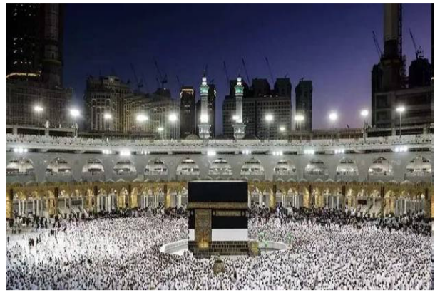
విజయవాడ సిటీ జూలై 31 (సందేశం టైమ్స్): రాష్ట్రంలోని ముస్లిం సులువుగా, సునాయాసంగా పవిత్ర స్థలం మక్కాకు