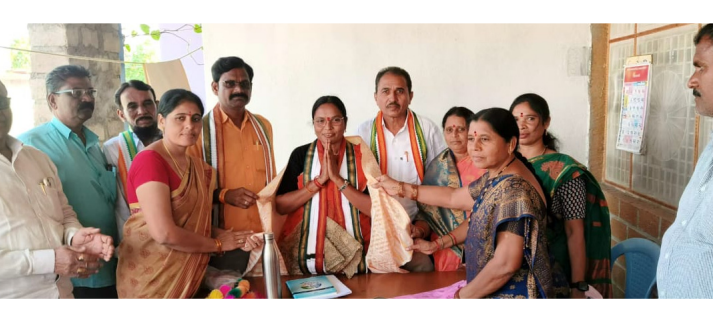
సందేశం టైమ్స్ నార్సర్, సందేశం 29: గ్రామపంచాయతీ ఎన్నికల్లో పార్టీ