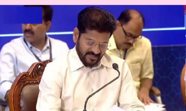
హైదరాబాద్, సందేశం టైమ్స్: ఈ నెల 5 న కేబినెట్ సమావేశం నిర్వహించి

కీలక అంశాలను చర్చించాలని మంత్రుల సమావేశంలో నిర్ణయించారు. ఇవాళ ఇంటిగ్రేటెడ్ కమాండ్ కంట్రోల్ సెంటర్ లో మంత్రులతో ముఖ్యమంత్రి రేవంత్ రెడ్డి సమావేశమయ్యారు. రాష్ట్ర అవతరణ వేడుకలు, ఇందిరమ్మ ఇండ్లు, రెవెన్యూ సదస్సులు, వాన కాంల పంటల సాగు సన్నద్ధత, రాజీవ్ యువ వికాసం అంశాలపై మంత్రులు అందించిన నివేదికపై సమావేశంలో చర్చించారు. మే 29, 30 తేదీలలో జిల్లాల్లో పర్యటించిన మంత్రులు ఈ నాలుగు అంశాలపై అధికారులతో సమీక్షలు నిర్వహించారు. అవతరణ దినోత్సవ వేడుకల ఏర్పాట్లతో పాటు ఇందిరమ్మ ఇళ్ల అభివృద్ధి తుది జాబితాలు, రెవెన్యూ సదస్సుల నిర్వహణ ఏర్పాట్లపై జిల్లా వారీగా తయారు చేసిన నివేదికలపై సమావేశంలో వివరించారు.