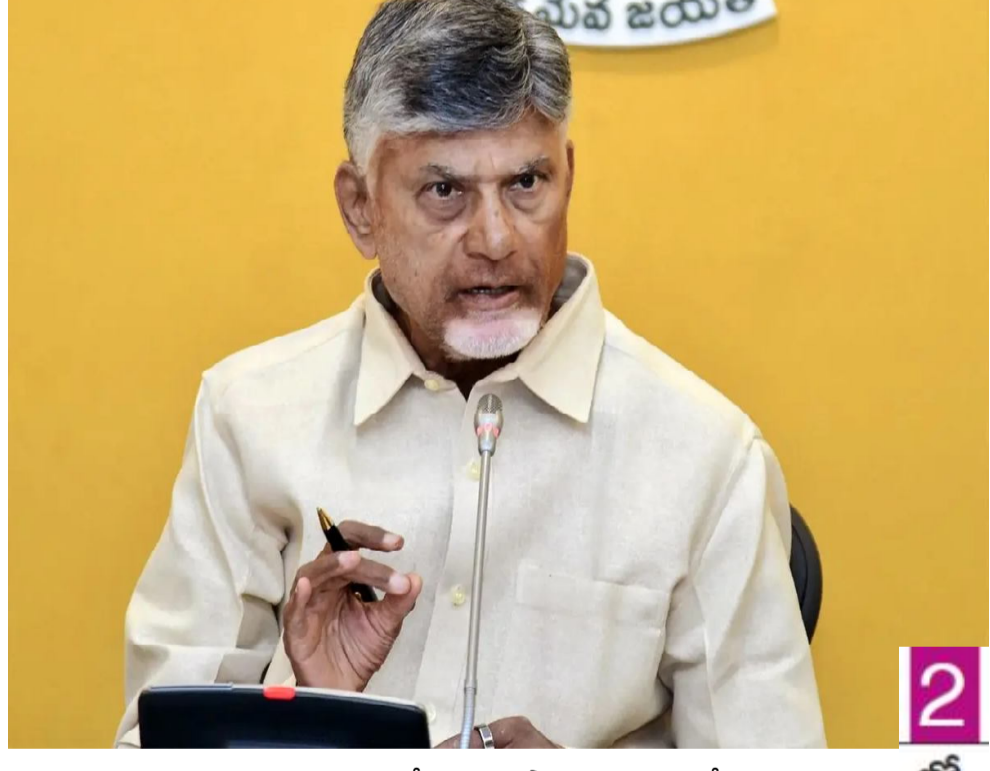
ఫైటర్లను ఆయన సత్కరించి, మెమొంటోలు, ప్రశంసాపత్రాలు అందజేశారు.