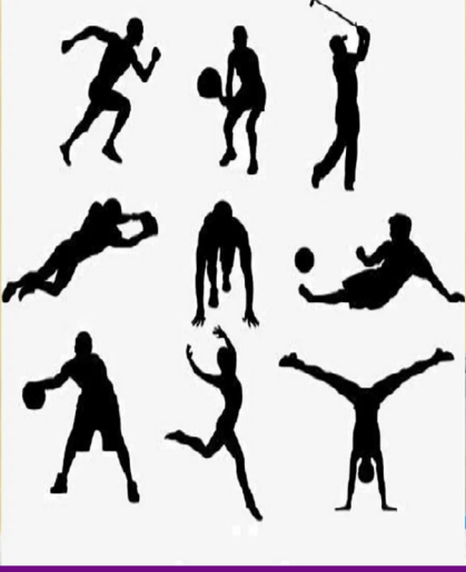
ఆగస్టు 02 (సందేశం టైమ్స్) : తెలంగాణ స్పోర్ట్స్ పాలసీ అంటోంది తెలంగాణలో

రేవంత్ సర్కార్.. పాత క్రీడావిధానాన్ని సమూలంగా మార్చి.. సరికొత్త స్పోర్ట్స్ పాలసీతో దూసుకెళ్తోంది. హైదరాబాద్ వేదికగా జరిగిన తెలంగాణ స్పోర్ట్స్ కాంగ్రెస్ ఫస్ట్ ఎడిషన్లో ముఖ్యమంత్రి రేవంత్ రెడ్డి చేతుల మీదుగా నూతన క్రీడా విధానం ఆవిష్కృతమైంది. ఒలింపిక్ పతకాలే మన పాలసీ లక్ష్యమని, ఆ విధంగా తెలంగాణ సర్కార్ దేశానికే అదర్భంగా ఉండాలని సీఎం రేవంత్ రెడ్డి చెప్పారు. యువత