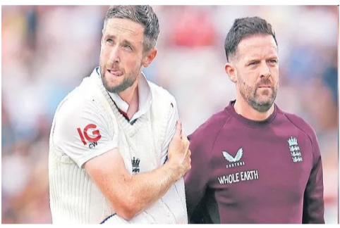
బ్యాటింగ్ కూ దూరమయ్యాడు. బౌలింగ్ లోనూ జట్టుకు టంగ్, ఒవర్లన్, అట్కిన్సన్ లపైనే ఆధారపడాల్సిన పరిస్థితి ఏర్పడింది.

లండన్: భారత్ తో జరుగుతున్న ఐదో టెస్టుకు ఇంగ్లండ్ పేసర్ క్రిస్ వాక్స్ గాయంతో దూరమయ్యాడు. తొలి రోజు లాంగ్ ఆఫ్ లో ఫీల్డింగ్ చేస్తున్న వాక్స్... కరుణ్ నాయర్ కొట్టిన బంతిని ఆపే ప్రయత్నంలో డ్రైవ్ చేశాడు. అయితే ఈ క్రమంలో తన శరీర బరువంతా ఎడమ భుజంపై పడడంతో గాయమైంది. స్కానింగ్ లో భుజం ఎముక స్థానభ్రంశం అయినట్లు తేలింది. దీంతో ఇంగ్లండ్ తొలి ఇన్నింగ్స్ లో అతడు