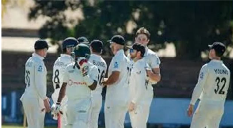
బులవాయో: జింబాబ్వేతో తొలి టెస్టును మూడు రోజుల్లోనే ముగించేసిన న్యూజిలాండ్ 9 వికెట్లతో

ఘన విజయం అందుకుంది. రెండు టెస్టుల సిరీస్ లో 1-0 ఆధిక్యంలో నిలిచింది. 8 పరుగుల లక్ష్యాన్ని కివీస్ ఒక వికెట్ కోల్పోయి ఛేదించింది. అంతకుముందు ఓవర్ నైట్ స్కోరు 31/2తో శుక్రవారం రెండో ఇన్నింగ్స్ కొనసాగించిన జింబాబ్వే 165 రన్స్ కు ఆటోటైండ్. తొలి ఇన్నింగ్స్ లో జింబాబ్వే 149, కివీస్ 307 పరుగులు చేశాయి.