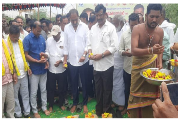
పొదిలి,(సందేశం టైమ్స్) : రాష్ట్రంలో రైతాంగానికి దశలవారీగా 9 గంటల విద్యుత్ అందిస్తామని విద్యుత్ శాఖ మంత్రి గొట్టిపాటి

రవికృష్ణ అన్నారు. గురువారం పొదిలి మండలం ఏలూరు గ్రామంలో 33/11 కెవి సబ్ స్టేషన్ నిర్మాణానికి శంకుస్థాపన చేశారు. అనంతరం ఆయన మీడియాతో మాట్లాడుతూ.. రాష్ట్రంలో ప్రతి నబ్ స్టేషన్ పరిధిలో సోలార్ విద్యుత్ ఉత్పత్తికి ఏర్పాటు చేస్తున్నామని.. ప్రతి రైతు తన పరిధిలో ఖాళీ స్థలాన్ని సోలార్ ప్లాంట్ ఏర్పాటుకు కృషి చేయాలన్నారు. అదేవిధంగా రాష్ట్రంలో రైతాంగానికి పగటిపూట, రాత్రిపూట నాలుగు గంటల పాటు ఇస్తున్న విద్యుత్తును పూర్తిస్థాయిలో 9 గంటల పగటిపూట అందిస్తామన్నారు. ప్రతి నియోజకవర్గానికి పదివేల ప్రధానమంత్రి సూర్యఫూర్ కనెక్షన్లు మంజూరు చేసామన్నారు. వాటిని సద్వినియోగం చేసుకోవాలని పిలుపునిచ్చారు.