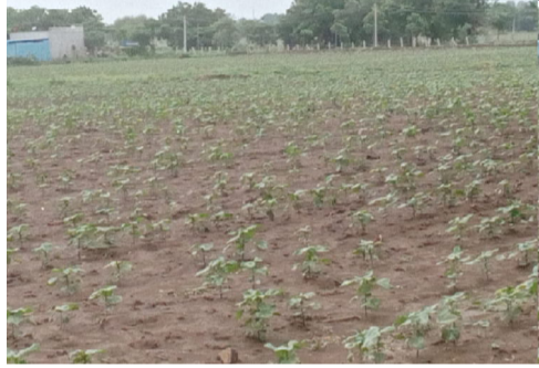
సందేశం టైమ్స్ (జూలై 3) ఉమ్మడి మెదక్ జిల్లా ప్రతినిధి నంగారెడ్డి జిల్లా ఆందోల్

నియోజకవర్గం లోని రైతులు చేసుకోవడం వల్ల వేయడం వలన వర్షాలు పడకపోవడంతో రైతులు ఆందోళన చెందారు. గత 15 రోజులుగా వర్షాలు పడకపోవడంతో పంటలు ఏమైతాయో అని రైతులు వారి ఆవేదనను వ్యక్తపరచుకున్నారు. గత రెండు మూడు రోజుల నుండి వర్షాలు కురవడంతో రైతులు ఊపిరి పీల్చుకున్నారు వేసిన పత్తి పంట కు వర్షాలు కురవడంతో వారు సంతోషించారు మరియు వర్షాలు పడడం వలన రైతులు ఆనందాన్ని వ్యక్తపరుస్తున్నారు.