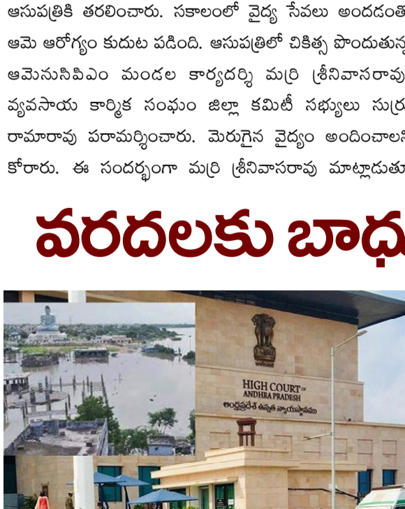
అమరావతి : (సందేశం టైమ్స్) : గతేడాది విజయవాడలో సంభవించిన వరదలకు జరిగిన నష్టానికి, వరదలకు 60 మంది ప్రాణాలు కోల్పోయారని, ఈ ప్రాణ నష్టానికి ఎవరు