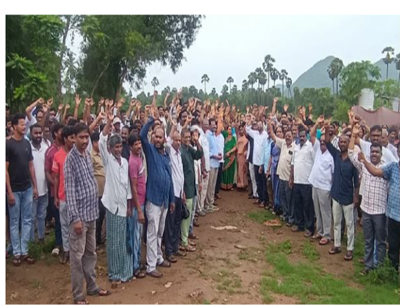
పెందుర్తి(విశాఖ)(సందేశం టైమ్స్) : వేపగుంటలో ఉన్న ఉడా వివాదాస్పద భూముల్లో స్థానిక రైతులు గురువారం నిరసన కార్యక్రమం చేపట్టారు. ఈ సందర్భంగా వారు

మాట్లాడుతూ.. సుమారు 50 సంవత్సరాలుగా ఈ భూమి సమస్య పరిష్కారం కావడం లేదని వాపోయారు. మా స్థలంలో మేము మొక్కలు వేస్తే.. ఉడా వారు వచ్చి మొక్కలను తొలగిస్తున్నారని ఆవేదన వ్యక్తం చేశారు. అప్పట్లో మా తాతలకు వాళ్ళుకు ఏదో అగ్రిమెంట్ జరిగిందని చెప్పన్నారు.. కానీ మాకు అయితే ఎటువంటి సప్లయ్ హోం రాలేదన్నారు. ఇక్కడ ఈ సమస్య పరిష్కారం కాకపోవడం వల్ల చుట్టుపక్కల ప్రాంతాలు అభివృద్ధి చెందుతున్న కానీ ఇక్కడ అభివృద్ధి జరగలేదని అసహనం వ్యక్తం చేశారు. ఇప్పటికైనా స్థానిక ఎమ్మెల్యే అధికారులు చొరవ తీసుకొని సమస్య పరిష్కారం చూపాలని కోరారు.