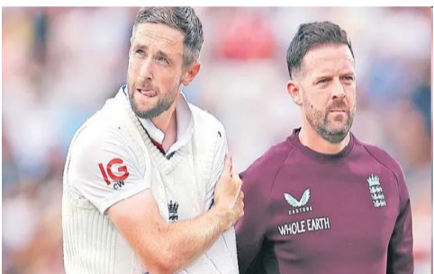
బ్యాటింగ్కూ దూరమయ్యాడు. బౌలింగ్లోనూ జట్టుకు టంగ్, ఒవర్లన్, అట్మిస్సన్లపైనే ఆధారపడాల్సిన పరిస్థితి ఏర్పడింది.

లండన్: భారత్తో జరుగుతున్న ఐదో టెస్టుకు ఇంగ్లండ్ పేసర్ క్రిస్ వాక్స్ గాయంతో దూరమయ్యాడు. తొలి రోజు లాంగ్ ఆఫ్లో ఫీల్డింగ్ చేస్తున్న వాక్స్... కరుణ్ నాయర్ కొట్టిన బంతిని ఆపే ప్రయత్నంలో డ్రైవ్ చేశాడు. అయితే ఈ క్రమంలో తన శరీర బరువంతా ఎడమ భుజంపై పడడంతో గాయమైంది. స్కానింగ్లో భుజం ఎముక స్థానభ్రంశం అయినట్లు తేలింది. దీంతో ఇంగ్లండ్ తొలి ఇన్నింగ్స్లో అతడు