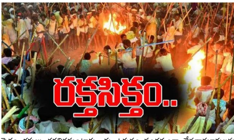
సైతం భక్తులు తరలివస్తుంటారు. ఈ ఉత్సవం సందర్భంగా దేవతామూర్తులను కాపాడటానికి భక్తులు కర్రలతో కొట్టుకోవడం సాంప్రదాయంగా వస్తోంది.

అక్టోబరు 3 (సందేశం టైమ్స్): కర్నూలు జిల్లా హెళగుండ మండలం దేవరగట్టు రాత్రి రక్తసిక్తంగా మారింది. బన్ని ఉత్సవం సందర్భంగా అర్ధరాత్రి అమ్మవారి వివాహం, ఊరేగింపు మొదలైంది. అయితే ఈ సందర్భంగా దేవతామూర్తులను తీసుకెళ్లే విషయంలో భక్తుల మధ్య పోటీ మొదలైంది. ఎలాగైనా దేవతామూర్తులను తమ ప్రాంతానికి తీసుకెళ్లాలని రెండు వర్గాలు కర్రలతో ఘర్షణకు దిగాయి. ఈ సందర్భంగా భక్తులంతా రింగులు తొడిగిన కర్రలతో కొట్టుకున్నారు. ఈ గొడవలో మొత్తం ముగ్గురు భక్తులు ప్రాణాలు కోల్పోయారు.. సుమారు 100 మందికి పైగా భక్తులు గాయపడ్డారు. గాయపడిన వారిని చికిత్స నిమిత్తం ఆదోని ఆసుపత్రికి తరలించారు. దేవరగట్టులో బన్ని ఉత్సవం ప్రతి ఏటా నిర్వహించడం అందరికీ తెలిసిందే. ఈ సందర్భంగా దేవతామూర్తులను కాపాడేందుకు మూడు గ్రామాల భక్తులు ఒకవైపు, ఏడు గ్రామాల భక్తులు మరొకవైపు నిలబడి కర్రలతో కొట్టుకుంటున్నారు. ఈ సమరాన్ని చూసేందుకు చుట్టు పక్కల ప్రాంతాల నుంచే కాకుండా సుదూర ప్రాంతాల నుంచి