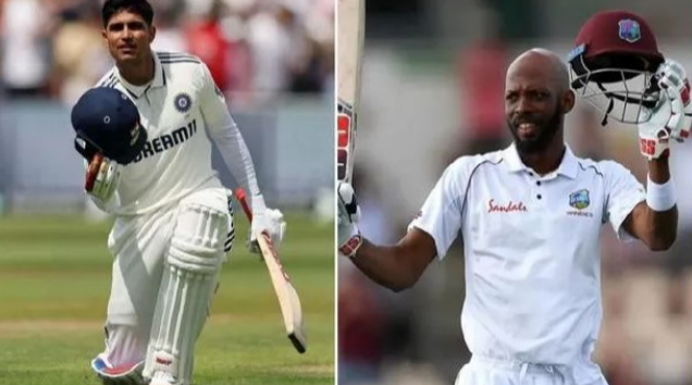
ఆసియా కప్ విజయోత్సాహం పూర్తిగా చల్లారకముందే టీమిండియా మరో సమరానికి సిద్ధమైంది. దాదాపు పది నెలల విరామం తర్వాత

స్వదేశంలో ఓ టెస్ట్ సిరీస్ ఆడుతోంది. వెస్టిండీస్ తో రెండు మ్యాచ్ల టెస్ట్ సిరీస్ ఆడబోతోంది. గుజరాత్లోని అహ్మదాబాద్ వేదికగా ఈ రోజు తొలి టెస్ట్ ప్రారంభమైంది. టాస్ గెలిచిన వెస్టిండీస్ కెప్టెన్ రోస్టన్ చేజ్ బ్యాటింగ్ ఎంచుకున్నాడు. దీంతో టీమిండియా బౌలింగ్కు రెడీ అవుతోంది. ఇద్దరు ప్రధాన పేసర్లు అయిన జస్ప్రీత్ బుర్రా, మహ్మద్ సిరాజ్ ఈ మ్యాచ్ ఆడుతున్నారు %భారత్: శుభ్షన్ గిల్, యశస్వి జైస్వాల్, కేఎల్ రాహుల్, సాయి సుదర్శన్, ధ్రువ్ జారెల్, రవీంద్ర జడేజా, వాషింగ్టన్ సుందర్, నితీష్ కుమార్ రెడ్డి, కుల్దీప్ యాదవ్, జస్ప్రీత్ బుర్రా, మహ్మద్ సిరాజ్ వెస్టిండీస్: త్యాగ్ నారాయణ్ చంద్రపాల్, జాన్ క్యాంపెబెల్, అలిక్ అధనెజ్, బ్రెండన్ కింగ్, పై హూవ్, రోస్టన్ చేజ్, జస్టిన్ గ్రీవ్స్, జోమెల్ వారికన్, ఫేర్ ఫియెరీ, జాన్ లైన్, జైడెన్ సీల్స్