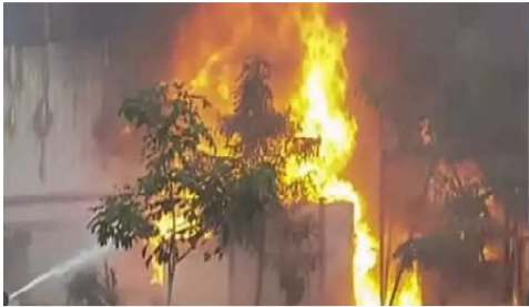
హైదరాబాద్ :అక్టోబరు 3 (సందేశం టైమ్స్): హైదరాబాద్ బేగంపేటలో భారీ అగ్నిప్రమాదం

ప్రమాదం జరిగింది. కనిష్క జ్యువెలరీ షాపులో షార్ట్ సర్క్యూట్తో మంటలు ఒక్కసారిగా ఎగిసిపడ్డాయి. స్థానికులు షేర్ సిబ్బంది సమాచారం అందించడంతో ఘటన స్థలానికి చేరుకున్న 3 ఫైరింగిస్టు మంటలను అదుపు చేశారు.. అయితే ప్రమాదానికి షార్ట్ సర్క్యూట్ కారణమని ప్రాథమికంగా అంచనా వేశారు. షాపు మూసి ఉన్న సమయంలో అగ్నిప్రమాదం జరగడంతో ప్రాణ నష్టం తప్పింది.