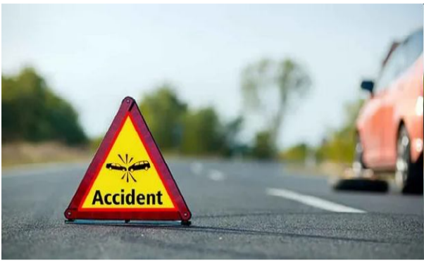
అందిస్తున్నారు. ఈ ఘటనకి సంబంధించి పూర్తి వివరాలు తెలియాల్సి ఉంది.

అంబేద్కర్ కోసీమ జిల్లా, నవంబర్ 3(సందేశం టైమ్స్): అంబేద్కర్ కోసీమ జిల్లా కొత్తపేట మండలం గంటి సమీపంలో రోడ్డు ప్రమాదం జరిగింది. ఈ ఘటనలో అయ్యప్ప స్వాములతో వెళ్తున్న బోలెరో వ్యాన్ అదుపు తప్పి పంట పొలాల్లోకి దూసుకువెళ్లింది. ఏలూరు జిల్లా చింతలపూడి మండలం రాఘవాపురం గ్రామానికి చెందిన 14 మంది అయ్యప్ప స్వాములు వారి కుటుంబ సభ్యులతో అంతర్వేది ఆలయానికి బయలు దేరారు. ఈ సమయంలో ప్రమాదవశాత్తు బోలెరో వ్యాన్ పంట పొలాల్లోకి దూసుకెళ్లింది. ఈ ప్రమాదంలో ఐదుగురు అయ్యప్ప స్వాములకి తీవ్ర గాయాలయ్యాయి. ఈ ప్రమాదం గురించి అంబేద్కర్ కోసీమ జిల్లా పోలీసులకు తెలియడంతో వెంటనే ఘటన స్థలానికి వెళ్లి సహాయక చర్యలు చేపట్టారు. ఈ ప్రమాదానికి గురైన వారిని వెంటనే స్థానిక ఆస్పత్రికి తరలించారు. ప్రస్తుతం క్షతగ్రాతులకి ఆస్పత్రిలో వైద్యం