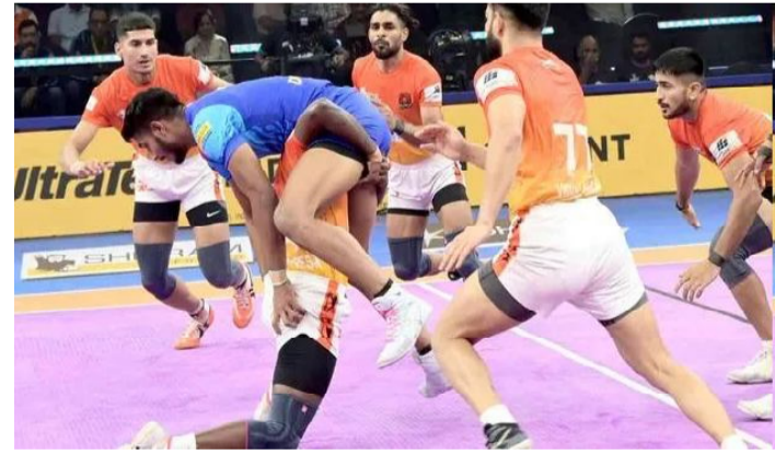
ప్రా కబడ్డీ లీగ్-12 తొలి అంచెలో భాగంగా బుధవారం జరిగిన తొలి