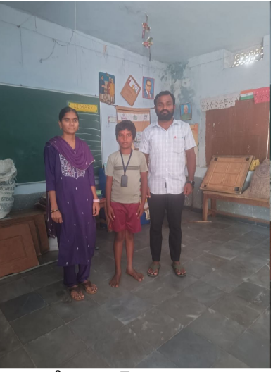
సందేశం టైమ్స్:సంగారెడ్డి జిల్లా ప్రతినిధి 4నవంబర్: సంగారెడ్డి జిల్లా వట్టిపల్లి మండలంలోని దరఖాస్తుపల్లి ప్రాథమిక పాఠశాలకు చెందిన 4వ