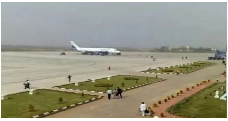
ఆదిలాబాద్, నవంబర్ 4(సందేశం టైమ్స్) : ఆదిలాబాద్ లో ఎయిర్ పోర్ట్ నిర్మాణానికి రాష్ట్ర ప్రభుత్వం గ్రీన్ సిగ్నల్ ఇచ్చింది. 700 ఎకరాల భూమి స్వాధీనం చేసుకోవాలని ప్రభుత్వం ఆదేశాలు జారీ చేసింది. తెలంగాణలో 6 ప్రాంతీయ ఎయిర్ పోర్టుల అభివృద్ధిలో