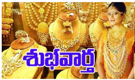
భారత స్త్రీలకు బంగారం అంటే ఎంత ఇష్టమో ప్రత్యేకంగా చెప్పక్కర్లేదు. ఎంత బంగారం ఉన్నా.. ఇంకా కావాలనే అంటారు. ఇక, శుభకార్యాలలో

కూడా బంగారం కీలక పాత్ర పోషిస్తూ ఉంటుంది. జనం పెట్టుబడులకు కూడా బంగారాన్ని ఎంచుకుంటున్నారు. అంతర్జాతీయ మార్కెట్లో చోటు చేసుకున్న పరిణామాలతో గత కొద్ది రోజుల నుంచి బంగారం ధరలు పెరుగుతూ పోయాయి. నేడు మాత్రం బంగారం కొనాలనుకునే వారికి ఊరట లభించింది. బంగారం ధరలు తగ్గాయి. హైదరాబాద్లో నిన్న 10 గ్రాముల 24 క్యారెట్ల బంగారం ధర 98,730 రూపాయల దగ్గర ట్రేడ్ అయింది. 10 గ్రాముల 22 క్యారెట్ల బంగారం ధర 90,500 రూపాయల దగ్గర.. 10 గ్రాముల 18 క్యారెట్ల బంగారం ధర 74,050 రూపాయల దగ్గర ట్రేడ్ అయింది. నిన్నటితో పోల్చుకుంటే పది గ్రాముల బంగారంపై.. గ్రాముకు ఒక రూపాయి చొప్పున 10 రూపాయలు తగ్గింది. 10 గ్రాముల 24 క్యారెట్ల బంగారం ధర 98,720 రూపాయల దగ్గర.. 10 గ్రాముల 22 క్యారెట్ల బంగారం ధర 90,490 రూపాయల దగ్గర.. 10 గ్రాముల 18 క్యారెట్ల బంగారం ధర .. 74,050 రూపాయల దగ్గర ట్రేడ్ అవుతోంది.