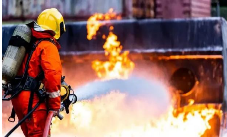
నిపుణులు లేకపోవడంతో పరిశ్రమల నియమించుకుని భద్రతా పరీక్షలు చేయించుకోవాలని సూచించారు. ఈ

ప్రక్రియ మార్చాలని తర్వాత అగ్నిమాపక శాఖకు సెల్స్ అఫిడవిట్ ఇవ్వాలని స్పష్టం చేశారు. ప్రతి పరిశ్రమలోనూ డస్ట్ సేఫ్టీ ఆడిట్ నిర్వహించాలని, ప్రతి విభాగంలో సేఫ్టీ ఆడిట్ క్షుణ్ణంగా చేయాలని స్పష్టం చేశారు. భవిష్యత్తులో ఏదైనా ప్రమాదం జరిగితే యాజమాన్యం తోపాటు సేఫ్టీ ఆడిట్ చేసిన థర్డ్ పార్టీని కూడా ప్రాసిక్యూషన్ చేస్తామని తెలిపారు.