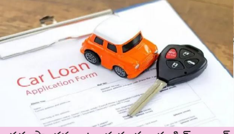
అర్హత పొందవు. ఉదాహరణకు యాక్సిస్ బ్యాంక్, మహింద్రా ఫైనాన్స్ వంటివి 10 సంవత్సరాల వరకూ పాత కార్లను అంగీకరిస్తాయి. అయితే బ్యాంక్ 12 సంవత్సరాల వరకూ అనుమతిస్తుంది.

పయోగపడుతుంది. దేశంలో అనేక బ్యాంకులు, నాన్-బ్యాంకింగ్ ఫైనాన్షియల్ కంపెనీలు కారును తాకట్టుగా ఉంచి అప్పులను అందిస్తాయి. ఇది సెక్యూరిటీ లోన్ కాబట్టి, సాధారణ వ్యక్తిగత రుణాల కంటే త్వరగా లభిస్తుంది. మీ కారు అప్పుకు అర్హమేనా? కానీ మీ కారుతో అప్పు తీసుకోవాలంటే కొన్ని షరతులు పాటించాల్సి ఉంటుంది. సాధారణంగా కారు మీ పేరుపై నమోదై పని చేస్తూ ఉండాలి. అలాగే దాని రుణం పూర్తిగా తీర్చి ఉండాలి. వాణిజ్య వాహనాలు, ఉత్పత్తి ఆగిపోయిన కార్లు లేదా వివాదంలో ఉన్న వాహనాలు అప్పుకు