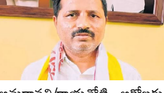
అమరావతి/రాయచోటి, అక్టోబరు 5(సందేశం టైమ్స్) : అన్నమయ్య జిల్లా తంబళ్లపల్లె నియోజకవర్గం ములకల చెరవులో వెలుగు