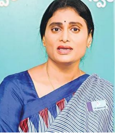
అమరావతి, అక్టోబరు 5(సందేశం టైమ్స్) : ఆటో డ్రైవర్లను మోసం చేసిన వైసీపీ ప్రభుత్వానికి,

కూటమి నర్కారుకూ తేడాలేదని వీసీసీ అధ్యక్షురాలు షర్మిల విమర్శించారు. గతంలో జగన్ 2.60 లక్షల మంది ఆటో డ్రైవర్లకు పదివేల రూపాయల చొప్పున ఇస్తే, కూటమి ప్రభుత్వం 2.90 లక్షల మందికి రూ.15 వేల చొప్పున ఇచ్చిందని ఆదివారం ఒక ప్రకటనలో తెలిపారు. ఆటో డ్రైవర్లను మోసం చేయడంలో దొందూదొందేనని విమర్శించారు. బ్యాండ్లీ ఉన్న ఆటో డ్రైవర్లకు ఏటా రూ. 15 వేలు ఇస్తామని కూటమి నేతలు మోసం చేశారని ఆరోపించారు. రాష్ట్రంలో బ్యాండ్లీ కలిగిన ఆటో డ్రైవర్లు 13 లక్షల మంది ఉంటే, జగన్ అందులో పదిశాతానికి లోపే(యజమానులకు) అమలు చేశారని,