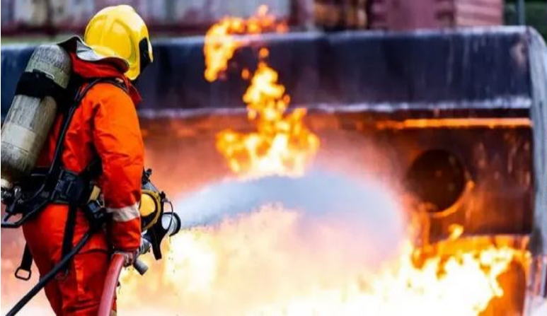
నిపుణులు లేకపోవడంతో పరిశ్రమల నియమించుకుని భద్రతా పరీక్షలు చేయించుకోవాలని సూచించారు. ఈ

ప్రక్రియ మార్చాలని తర్వాత అగ్నిమాపక శాఖకు సెల్స్ అఫిడవిట్ ఇవ్వాలని స్పష్టం చేశారు. ప్రతి పరిశ్రమలోనూ డస్ట్ సేఫ్టీ ఆడిట్ నిర్వహించాలని, ప్రతి విభాగంలో సేఫ్టీ ఆడిట్ క్షుణ్ణంగా చేయాలని స్పష్టం చేశారు. భవిష్యత్తులో ఏదైనా ప్రమాదం జరిగితే యాజమాన్యం తోపాటు సేఫ్టీ ఆడిట్ చేసిన థర్డ్ పార్టీని కూడా ప్రాసిక్యూషన్ చేస్తామని తెలిపారు.