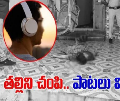
తల్లిని చంపి.. పాటలు వింటా..