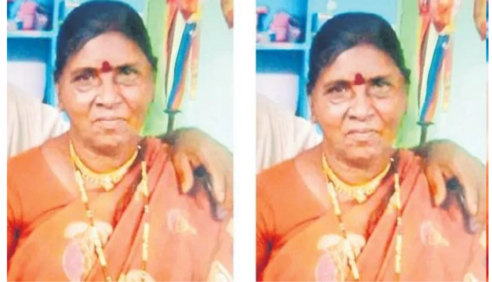
గోనె సంచుల్లో కట్టి కాల్యల్లో పడేసిన వైనం విజయవాడలో దారుణం.. పోలీసుల అదుపులో తండ్రికొడుకు