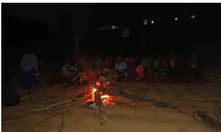
కాపాలుగా ఉంటున్నారు. ఈ దయనీయ స్థితి రంగారెడ్డి జిల్లా మొయినాబాద్ మున్సిపాలిటీ పరిధిలోని ఎన్నోపల్లి రైతులకు ఏర్పడింది.

మొయినాబాద్, జూలై 8(సందేశం టైమ్స్) : దశాబ్దాలుగా భూమిని నమ్ముకుని.. సాగు చేసుకుంటూ జీవనాధారం పొందుతున్న రైతులకు ప్రభుత్వం కంటిమీద కునుకు లేకుండా చేస్తున్నది. రైతులకు బువ్వ పెట్టే భూమిని ప్రభుత్వం అప్పనంగా తీసుకునే ప్రయత్నం చేస్తూ రైతులను నిర్వాసితులను చేయడానికి ప్రభుత్వం ప్రయత్నిస్తుంది. కంటి తుడుపుగా పరిహారం చెల్లిస్తే తీసుకునేది లేదని.. భూములను వదలమని రైతులు మొండిగా వ్యవహరిస్తున్నారు. ఏ సమయంలో ప్రభుత్వం పోలీసులను పెట్టి స్వాధీనం చేసుకుంటుందోనని భయంతోనే రైతులు భూముల వద్ద రాత్రి, పగలా కాపలా ఉంటున్నారు. ఆకలికి ఓర్చుకుంటూ రాత్రి సమయంలో చలి మంటలు కాస్తూ భూమికి