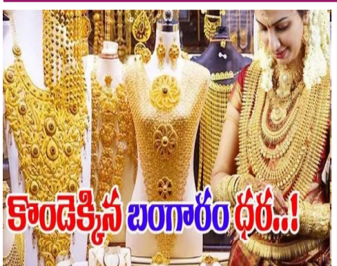
కొండెక్కెన బంగారం ధరలు

బిజినెస్ డెస్క్: దేశంలో పసిడి ధరలు ఆల్ టైం గరిష్టానికి చేరుకుని మరోసారి షాక్ ఇచ్చాయి. ఈ నేపథ్యంలో ఆగస్టు 8, 2025 ఉదయం 6:10 గంటల సమయానికి బంగారం ధరలు సరికొత్త స్థాయికి చేరాయి. 24 క్యారెట్ల 10 గ్రాముల బంగారం ధర రూ. 1,02,560కి చేరగా, 22 క్యారెట్ల 10 గ్రాముల బంగారం ధర రూ. 94,010కి చేరుకుంది. %ఇదే సమయంలో వెండి ధరలు కూడా పెరిగాయి. కిలో వెండి ధర రూ. 1,17,100 స్థాయిలో ఉంది. ఈ ధరల పెరుగుదల దేశవ్యాప్తంగా వివిధ నగరాల్లో కొనసాగుతోంది. స్థానిక వస్తులు, రవాణా ఖర్చులు, మార్కెట్ డిమాండ్ ఆధారంగా ధరల్లో స్వల్ప వ్యత్యాసాలు కనిపిస్తున్నాయి.