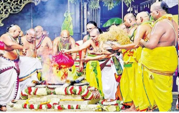
తిరుమల, ఆగస్టు 8(సందేశం టైమ్స్): తిరుమలలో పవిత్ర పూర్ణాహుతితో మూడురోజుల పవిత్రోత్సవాలు ముగిశాయి.