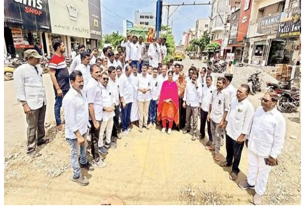
నంద్యాల రూరల్, ఆగస్టు 8(సందేశం టైమ్స్): బీసీలపై ప్రభుత్వం కక్ష సాధింపు చర్యలు తగవని వైసీపీ బీసీ సెల్