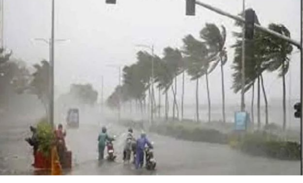
విశాఖపట్నం సెప్టెంబర్ 8 (సందేశం టైమ్స్) : వాయవ్య పశ్చిమ

మధ్య బంగాళాఖాతం పరిసరాల్లో ఆవరించిన ఉపరితల ఆవర్తనం స్థిరంగా కొనసాగింది. కోస్తాలో అనేకచోట్ల ఎండ తీవ్రంగా ఉంది. కావలిలో 38.8 డిగ్రీల గరిష్ట ఉష్ణోగ్రత నమోదైంది. మరోవైపు కోస్తాలో పలుచోట్ల వాతావరణ అనిశ్చితితో ఉరుములు, పిడుగులు, ఈడుగుగాలులతో వర్షాలు కురిశాయి. చేబ్రోలులో 7.4, గూడవల్లిలో 5.8, ఎస్. రాయవరంలో 4.8, పార్వతీపురంలో 4 సెంటీమీటర్ల వర్షపాతం నమోదైంది.