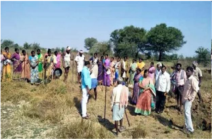
అమరావతి, సెప్టెంబర్ 9 (సందేశం టైమ్స్): రాష్ట్ర వ్యాప్తంగా సుమారు 10 వేల మంది ఫీల్డ్ అసిస్టెంట్లు ఉపాధి పథకంలో పనిచేస్తుంటే కేవలం 3 వేల మంది సిబ్బంది మాత్రమే ఎఫ్టీఈ(ఫిక్సిడ్ టెన్యూర్ ఎంప్లాయిస్)గా