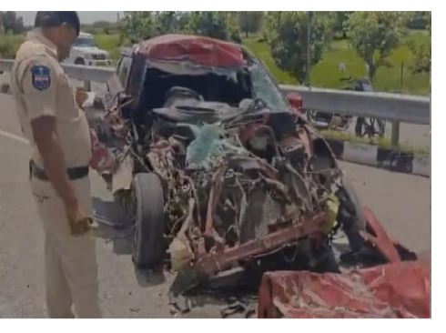
సందేశం టైమ్స్ న్యూస్ నారాయణఖేడ్ ప్రాతినిధి సెప్టెంబర్ 9: జాతీయ రహదారి 161 పైవే