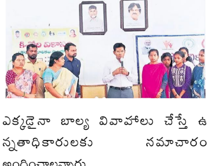
ఎక్కడైనా బాల్య వివాహాలు చేస్తే ఉన్నతాధికారులకు సమాచారం అందించాలన్నారు.