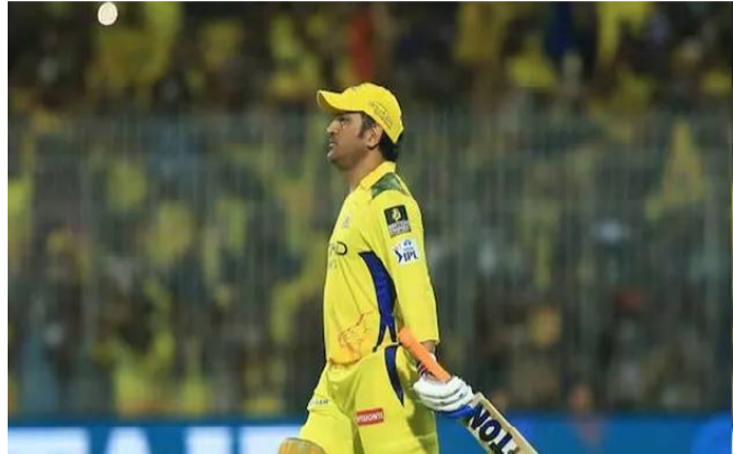
తప్పకుండా ఆదాలి సర్ అని అరిచాడు. దానికి ధోనీ స్పందిస్తూ.. 'నా మోకాలు నొప్పిగా ఉంది. దానిని ఎవరు భరిస్తారు' అని సరదాగా ప్రశ్నించాడు.

టీమిండియా మాజీ లెజెండ్ ఎంఎస్ ధోనీ అంతర్జాతీయ క్రికెట్ నుంచి వైదొలిగి బదేళ్లు పూర్తయింది. అయితే ఐపీఎల్ లో చెన్నై సూపర్ కింగ్స్ జట్టు తరపున మాత్రం ధోనీ ఆడుతున్నాడు. ధోనీని తమిళ అభిమానులు ఎంతగానో అభిమానిస్తారు. ధోనీని పసుపు రంగు జెర్సీలో చూసి మురిసిపోతారు. ధోనీ ఎప్పటికీ ఐపీఎల్ ఆడుతూనే ఉండాలని కోరుకుంటారు. అయితే మోకాలి నొప్పితో బాధపడుతున్న ధోనీ వచ్చే సీజన్ ఆడతాడో, లేదో ఇంకా క్లారిటీ లేదు. తాజాగా ధోనీ ఓ కార్యక్రమంలో పాల్గొన్నాడు. ఆ కార్యక్రమంలో ధోనీకి వచ్చే ఐపీఎల్ లో ఆడతారా? అనే ప్రశ్న ఎదురైంది. వ్యాఖ్యాతల నుంచి వచ్చిన ఆ ప్రశ్నకు ధోనీ స్పందిస్తూ.. 'వచ్చే సీజన్ ఆడతానో లేదో తెలియదు. అయినా అందుకు ఇంకా చాలా సమయం ఉంది. డిసెంబర్ లో నిర్ణయం తీసుకుంటా. ఇప్పుడే చెప్పడం సరైంది కాదు' అని ధోనీ చెప్పాడు. ఆ సమయంలో ఓ అభిమాని.. 'మీరు