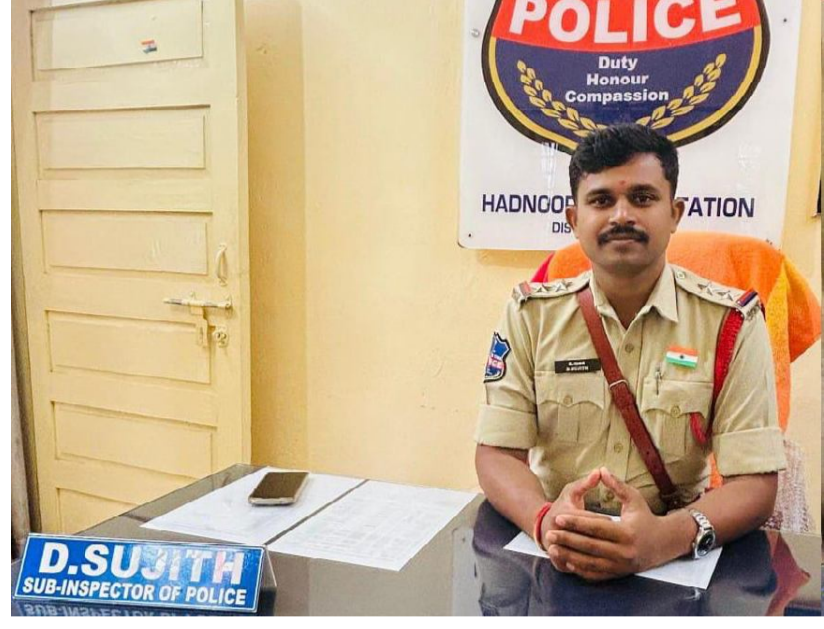
ఈ అవకాశాన్ని వినియోగించుకోవాలని, తమ కోర్టు కేసుల వివరాల కోసం హద్దుసూర్ పోలీస్ స్టేషన్ ను ప్రదించగలరని మండల ప్రజలకు విజ్ఞప్తి చేయబడినది

కేసు సంబంధిత ఇరువక్షాలు పరస్పర అంగీకారంతో తమ వివాదాలను త్వరితంగా పరిష్కరించుకోవచ్చు. కోర్టు తలుపులు తట్టకుండా రాజీపడే అవకాశాన్ని ప్రజలు సద్వినియోగం చేసుకోవాలని హద్దుసూర్ పోలీస్ స్టేషన్ అధికారి ఎస్ఐ సూచించారు.