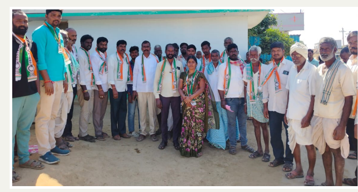
సందేశం టైమ్స్ : సంగారెడ్డి జిల్లా పట్టణ మండలం సాయిపేట గ్రామంలో

సర్పంచ్ ఎన్నికల నేపథ్యంలో అభ్యర్థులు వివరించారు. ప్రజల్లోనే ఉంటూ వాటిని ప్రజలను కలుసుకుంటూ ఇంటింటి పరిష్కరించేందుకు పనిచేస్తానని ఆమె ప్రచారాన్ని నిర్వహిస్తున్నారు. గ్రామస్థులు ప్రజాస్వామ్య హక్కును వినయంగా వినియోగించి, అభ్యర్థుల పనితీరు, సామర్థ్యం, గ్రామాభివృద్ధి కోసం ఉన్న దృష్టిని పరిగణనలోకి తీసుకుని తమ ఓటు నిర్ణయం తీసుకోవాలని సూచించారు. ఈ కార్యక్రమంలో గ్రామానికి చెందిన పార్టీ కార్యకర్తలు, యువత, స్థానిక వారి సమస్యలు, అవసరాలు తెలుసుకుంటూ భవిష్యత్ ప్రణాళికలను