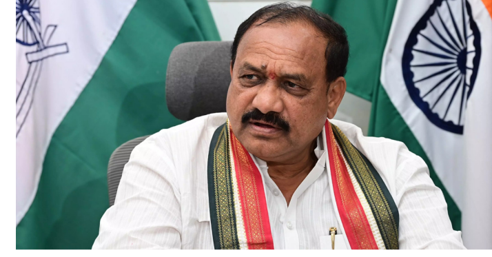
అన్నారు. ప్రజా పాలన పట్ల ప్రజల సంపూర్ణ వంచాయతీ ఎన్నికల్లో స్పష్టంగా ప్రతిఫలించిందని మహేశ్ కుమార్ గౌడ్ అన్నారు. ముఖ్యమంత్రి రేవంత్ రెడ్డి, మంత్రులు గ్రామస్థాయి సమస్యలను ఆర్డం చేసుకుని వాటి పరిష్కారానికి

అధ్యక్షుడు మహేశ్ కుమార్ స్పందించారు. రాష్ట్ర వ్యాప్తంగా సర్పంచి ఎన్నికల్లో కాంగ్రెస్ బలపరిచిన అభ్యర్థులు విజయం సాధించడం ప్రజల విశ్వాసానికి నిదర్శనమని ఆయన అన్నారు. కాంగ్రెస్ మద్దతుదారు అభ్యర్థులు ఘన విజయం సాధించడంపై హర్షం వ్యక్తం చేశారు. స్థానిక ఎన్నికల్లో సామాజిక న్యాయం స్పష్టంగా కనిపించిందని అన్నారు. మొదటి విడత ఎన్నికల్లో 90 శాతం కంటే ఎక్కువ స్థానాల్లో కాంగ్రెస్ మద్దతు ఇచ్చిన అభ్యర్థులే విజయం సాధించారని తెలిపారు. కాంగ్రెస్ ప్రభుత్వంపై ప్రజల నమ్మకానికి ఈ ఫలితాలు నిదర్శనమని అన్నారు. ప్రజల ఆశయాలకు అద్దం వట్టే ఈ ఫలితాలు, ప్రభుత్వంపై వారి