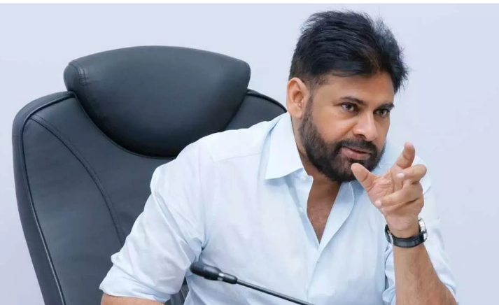
సోషల్ మీడియా ప్లాట్ఫామ్ 'ఎక్స్' లో ఓ పోస్ట్ పెట్టారు. సుబ్రహ్మణ్య భారతి

తాను, సుబ్రహ్మణ్య భారతి జీవితం నుంచి మూడు ముఖ్యమైన పాఠాలు నేర్చుకున్నానని పవన్ కల్యాణ్ తెలిపారు. "1) మాతృభూమి పట్ల నిర్ణయమైన నిబద్ధత, 2) మాతృభూమిపై ప్రేమ, 3) బహుభాషా నైపుణ్యాలు, ఇతర భాషల పట్ల గౌరవం.. ఈ మూడు విషయాలు ఆయన నుంచి నేర్చుకోవాలి. ఆయన నిజంగా భారతరత్నకు అర్హుడు" అని తన పోస్ట్ లో పేర్కొన్నారు. మరోవైపు, హరికే శంకర్ డైరెక్టర్ లో పవన్ కల్యాణ్ నటిస్తున్న యాక్షన్ ఎంటర్టైన్మెంట్ 'ఉస్మాన్ భగత్ సింగ్' సినిమా అవ్వడం కోసం అభిమానులు ఆసక్తిగా ఎదురుచూస్తున్నారు. ఈ చిత్రం నుంచి 'దేఖేం సా' అనే ఫస్ట్ సింగిల్ కు