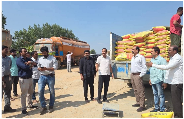
సందేశం టైమ్స్ అనంతపురం, డిసెంబర్ 12. సిమెంట్ లో పై యాప్ ను మిక్స్ చేసి ఒరిజినల్ సిమెంట్ గా అక్రమంగా అమ్ముతున్న కస్తూరి సిమెంట్స్ పై విజిలెన్స్ అధికారుల ఆకస్మిక దాడి. అనంతపురము