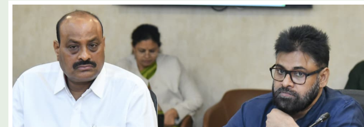
విరాపాక్ష ఆర్కానిక్ కు 100 ఎకరాల భూమి

చట్టాలు, బోధనలపై కీలక నిర్ణయాలు బ్రిటిష్ కాలం నాటి పాత చట్టాలను రద్దు చేస్తూ జైల్ల సంస్కరణల దిశగా ప్రభుత్వం కీలక ఆడుగు వేసింది. కేంద్ర హోం మంత్రిత్వ శాఖ రూపొందించిన 'మోడల్ ప్రిజెన్స్ యాక్ట్ 2023'కు అనుగుణంగా 'ది ఆన్ డ్రప్రచేజ్ ప్రిజెన్స్ అండ్ కరెక్షన్ల సర్వీసెస్ యాక్ట్, 2025' ముసాయిదా బిల్లుకు కేబినెట్ ఆమోదం తెలిపింది. ఈ బిల్లును త్వరలో శాసనసభలో ప్రవేశపెట్టనున్నారు. గంజాయి వంటి నేరాలకు పాల్పడిన ఖైదీలకు