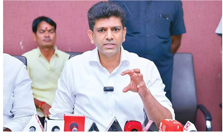
సద్వినియోగం చేసుకోలేక రాష్ట్ర భవిష్యత్తును నాశనం చేశారని ఆరోపించారు. అమరావతిని ప్రణాళికాబద్ధంగా అభివృద్ధి

రాజధానిగా గుర్తిస్తూ బిల్లు ప్రవేశపెడతామని ఆయన తెలిపారు. రాజధానిని 2014 నుంచి గుర్తించాలా? లేక ఇప్పటి నుంచి గుర్తించాలా? అనే దానిపై ఉన్న సాంకేతిక కారణాల వల్లే బిల్లు అలస్యమవుతోందని పెమ్మసాని వివరించారు. ఈ ప్రక్రియను ముఖ్యమంత్రి చంద్రబాబు స్వయంగా పర్యవేక్షిస్తున్నారని అన్నారు. అమరావతి బిల్లుపై వైసీపీ అధినేత జగన్ విషం కక్కుతున్నారని, ఆయనను శాశ్వతంగా రాజకీయ సమాధి చేయాలని తీవ్ర వ్యాఖ్యలు చేశారు. జగన్ కు పాలన చేతకాకపోవడం వల్లే 34 వేల మంది రైతులు ఇచ్చిన భూములను