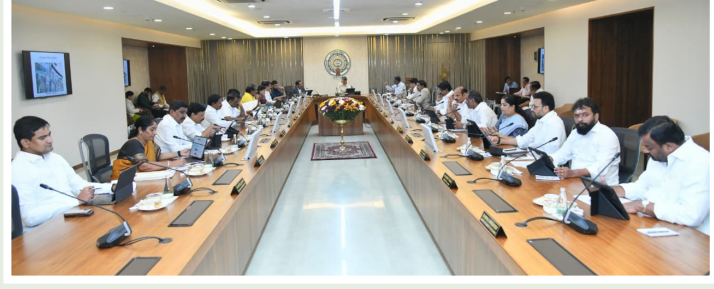
227 తెలుగు, 91 హిందీ భాషా పండితుల పోస్టులతో పాటు 99 వ్యాయామ ఉపాధ్యాయులు (సీ.డి.) పోస్టులను న్యూల్ అసిస్టెంట్ కేడర్ కు ఉన్నతీకరించారు.

లైన్ ఎలివేషన్ కారిడార్ నిర్మాణానికి సంబంధించిన ఎల్1 బిడ్ను ఆమోదించారు. ఈ ప్రాజెక్టులో ఇంటర్నేషనల్, మంజూరు, అందరేషన్లు కూడా భాగంగా ఉంటాయి. ఈ ప్రాజెక్టు కాంట్రాక్టు విలువ రూ.532 కోట్ల 57 లక్షలుగా నిర్ణయించారు. డి.టి.పాట, చిత్తూరు జిల్లా కుప్పంలోని పలారీ సదిపై ఉన్న చెక్ డ్యామ్ మరమ్మత్తులు, పునర్నిర్మాణ పనుల కోసం సవరించిన పరిపాలనా ఆమోదాన్ని కేబినెట్ మంజూరు చేసింది. గతంలో రూ.10.24 కోట్లుగా ఉన్న ఈ ప్రాజెక్టు వ్యయం రూ.15.96 కోట్లకు పెంచుతూ నిర్ణయం తీసుకున్నారు.