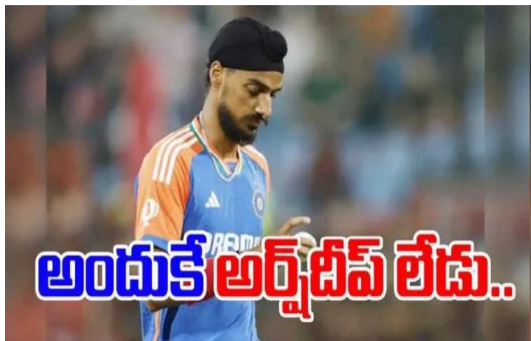
అందుకే అర్డ్ దీప్ లేడు..