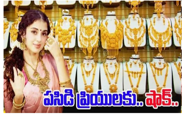
పసిడి త్రియ్యలకు.. షాక్.. బంగారం కొనాలనుకునే వారికి షాక్. బంగారం ధర రోజూ పెరుగుతూ సరికొత్త రికార్డులను నమోదు చేస్తోంది. భౌగోళిక రాజకీయ అనిశ్చితుల నేపథ్యంలో పెట్టుబడిదారులు సురక్షిత ఆస్తుల వైపు మొగ్గు చూపుతుండడంతో

బంగారానికి డిమాండ్ పెరుగుతోంది. డాలర్తో పోల్చుకుంటే రూపాయి క్షీణిస్తుండడం కూడా బంగారం పెరుగుదలకు కారణంగా కనిపిస్తోంది. ఈ నేపథ్యంలో ఈ రోజు (సెప్టెంబర్ 13న) 24 క్యారెట్ల పది గ్రాముల బంగారం ధర 1, 11, 290కి చేరింది. 22 క్యారెట్ల 10 గ్రాముల బంగారం ధర రూ. 1, 02, 010కి చేరింది ఢిల్లీలో 24 క్యారెట్ల పసిడి రేటు 10 గ్రాములకు రూ. 1, 11, 440కి చేరుకోగా, 22 క్యారెట్ల గోల్డ్ ధర 10 గ్రాములకు రూ. 1, 02, 160కి చేరుకుంది. ఇక హైదరాబాద్, విజయవాడలో 24 క్యారెట్ల 10 గ్రాముల బంగారం ధర రూ. 1, 11, 290కి చేరుకోగా, 22 క్యారెట్ల 10 గ్రాముల గోల్డ్ రేటు రూ. 1, 02, 010కి చేరింది. వెండి ధరలు నిన్నటితో పోల్చుకుంటే కేజీకి వంద రూపాయల మేర పెరిగాయి. ఈ క్రమంలో దేశంలోని ప్రధాన నగరాల్లో ఉన్న బంగారం, వెండి రేట్లను ఇప్పుడు తెలుసుకుందాం