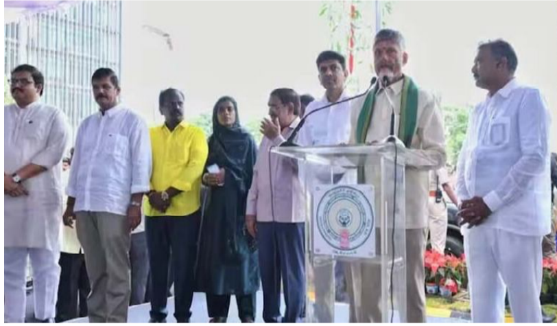
అభివర్ధించి అవహేళన చేశారని ఆవేదన వ్యక్తం చేశారు. మిగతా 2లో...

అమరావతి, అక్టోబరు 13 (సందేశం టైమ్స్) : ఆంధ్రప్రదేశ్ రాజధాని రాజధాని కోసం భూములు త్యాగం చేసిన అమరావతిలో ఐదేళ్ల నిరీక్షణకు రైతులను ఉద్దేశించి ఉద్వేగభరితంగా తెరదించుతూ నూతన అధ్యాయం ప్రసంగించారు. వారి త్యాగాలను ప్రారంభమైంది. సీఎం చంద్రబాబు ఎప్పటికీ మరువలేనని, వారికి అన్ని సోమవారం రాజధాని ప్రాంతంలో విధాలా అండగా ఉంటానని హామీ నిర్మించిన సీఆర్డీఏ (రాజధాని ప్రాంత ఇచ్చారు. గత ఐదేళ్ల కష్టాలను అభివృద్ధి ప్రాధికార సంస్థ) కార్యాలయ గుర్తుచేసుకున్న సీఎం గత ఐదేళ్లలో భవనాన్ని లాంఛనంగా ప్రారంభించారు. రాజధాని రైతులు, ముఖ్యంగా మహిళలు ఈ భవనం ప్రారంభం కేవలం ఆరంభం పడిన కష్టాలను, అవమానాలను తాను మాత్రమేనని, అమరావతి అభివృద్ధి కక్షలూ చూశానని చంద్రబాబు అన్నారు. ప్రస్థానం ఇప్పుడే మొదలైందని ఆయన రాజధానిని ఎడారిగా, నృశానంగా