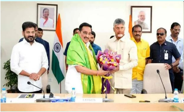
జూలై 16 (సందేశం టైమ్స్): కేంద్ర జల శక్తి శాఖ మంత్రి సీ ఆర్ పాటిల్ తో తెలుగు రాష్ట్రాల ముఖ్యమంత్రుల సమావేశం బుధవారం సాయంత్రం న్యూఢిల్లీలో ముగిసింది.

జల వివాదాలపై సుమారు గంటన్నర పాటు ఈ సమావేశం కొనసాగింది. అయితే ఈ సమావేశంలో పోలవరం- బనకచర్ల ప్రాజెక్ట్ అవశ్యతను సీఎం చంద్రబాబు వివరించారు. గోదావరి నుంచి సముద్రంలోకి ఏటా 2 వేల నుంచి 3 వేల ప్రాజెక్టులు సముద్రంలో కలుస్తాయని తెలిపారు. ఈ నీటిని బనకచర్ల ద్వారా రాయలసీమకు మళ్లిస్తే ఆ ప్రాంతం లబ్ధి చేకూరుతోందని ఈ సందర్భంగా చెప్పారు. అందుకు సంబంధించిన సమగ్ర వివరాలను కేంద్ర మంత్రి సీ ఆర్ పాటిల్ కు అందజేశారు. ఏ ఒక్క రాష్ట్రానికి ఇబ్బంది కలిగించకుండా.. సముద్రంలోకి వెళ్లి వెళ్లి గోదావరి మిగులు జలాలను వినియోగించుకోవడమే లక్ష్యమని సీఎం చంద్రబాబు ఈ సమావేశంలో స్పష్టం చేసినట్లు తెలుస్తుంది. అలాగే తెలంగాణ ప్రభుత్వం ప్రతిపాదించిన ఎజెండాలోని 13 అంశాలపై ఈ సమావేశంలో చర్చించారు. ఈ సందర్భంగా పలు ప్రాజెక్టుల విషయంలో సీఎం చంద్రబాబు ఎటువంటి అభ్యంతరం తెలపలేదు.