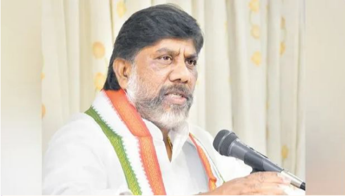
హైదరాబాద్, జూలై 16 (సందేశం టైమ్స్): రాష్ట్రంలో పెరుగుతున్న డిమాండ్ కు అనుగుణంగా విద్యుత్ సరఫరా చేయాలని, భవిష్యత్తులో పెరిగే ఏర్పాటు ప్రక్రియను వేగవంతం చేయాలని సూచించారు. రెన్యూబుల్ ఎనర్జీపై విద్యుత్ డిమాండ్ ను అధిగమించడానికి అవసరమైన చర్యలు తీసుకోవాలని దృష్టి సారించాలన్నారు.

ఉప ముఖ్యమంత్రి భట్టివిక్రమారావు విద్యుత్ అధికారులను ఆదేశించారు. బుధవారం విద్యుత్ శాఖల ఉన్నతాధికారులతో ఆయన సమీక్ష నిర్వహించారు. రాష్ట్రంలో విద్యుత్ డిమాండ్ 2024 నుంచి 9.8 శాతం చొప్పున పెరుగుతోందని.. 2034 నాటికి అది 33,773 మెగావాట్లకు చేరుకునే అవకాశం ఉందని కేంద్ర సంస్థలు విశ్లేషించినట్లు తెలిపారు. కొత్త సబ్ స్టేషన్లను నిర్మించాలని, వాటి నిర్మాణ ప్రాంతంలో భూమి కోల్పోయిన వారికి ఉద్యోగావకాశాలు కల్పించే విషయంపై దృష్టి సారించాలని సూచించారు. హైదరాబాద్ లో అందర్ గ్రాండ్ ఎలక్ట్రిసిటీ కేబుల్స్ నిర్మాణం కోసం పూర్తిస్థాయిలో డివీఆర్ సిద్ధం చేయాలని ఆదేశించారు. విద్యుత్ ట్రాన్స్మిషన్ల ఏర్పాటుకు స్థలం కొరత ఏర్పడుతున్న నేపథ్యంలో ప్రస్తుతం ఉన్న 12.5 మిలియన్ యూనిట్ల ట్రాన్స్మిషన్ల స్థానంలో 16 మిలియన్ యూనిట్ల పవర్ ట్రాన్స్మిషన్ల డిమాండ్ ను అధిగమించడానికి అవసరమైన చర్యలు తీసుకోవాలని దృష్టి సారించాలన్నారు.