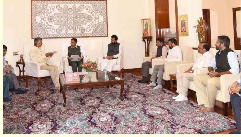
ప్రమాణాలతో బ్యాడ్మింటన్ శిక్షణా కేంద్రం ఏర్పాటుకు సహకరించాలని విజ్ఞప్తి చేశారు. అమరావతిలో జాతీయ జల క్రీడల శిక్షణ హాబ్ ఏర్పాటుకు అవకాశం

అందించాలని కేంద్ర ప్రభుత్వానికి ముఖ్యమంత్రి విజ్ఞప్తి చేశారు. రాష్ట్రంలో క్రీడాభివృద్ధి కోసం చేపట్టాల్సిన ప్రాజెక్టులు, మౌలిక సదుపాయాల కల్పనపై కేంద్ర మంత్రితో సీఎం చర్చించారు. అమరావతిలో జాతీయ జల క్రీడల శిక్షణా హాబ్ ఏర్పాటు చేసేందుకు అవకాశం ఉందని ముఖ్యమంత్రి పేర్కొన్నారు.. ఏపీలో క్రీడల అభివృద్ధికి కేంద్ర పరంగా తగిన సహాయం చేయాలని కోరారు.. అమరావతిలో అంతర్జాతీయ ఏర్పాటుకు సహకరించాలని విజ్ఞప్తి చేశారు. అమరావతిలో జాతీయ జల క్రీడల శిక్షణ హాబ్ ఏర్పాటుకు అవకాశం