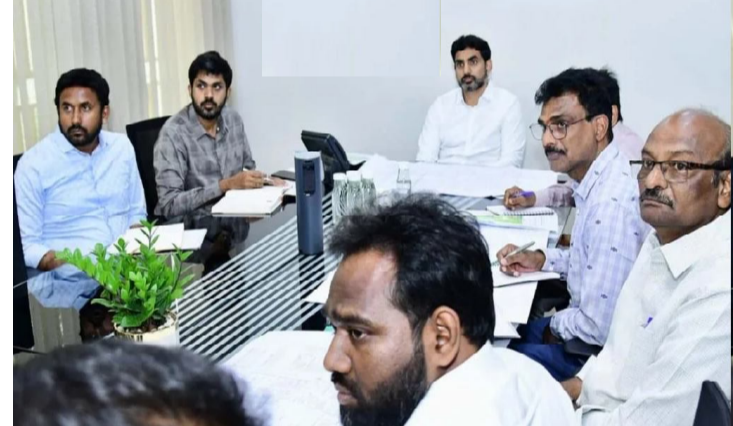
31 కమ్యూనిటీ హాళ్లు, 26 పార్కులు, శృశానాల నిర్మాణాలను త్వరితగతిన పూర్తిచేసేందుకు చర్యలు తీసుకోవాలని అధికారులను ఆదేశించారు.

మంగళగిరి జూలై16(సందేశం టైమ్స్): గతంలో 3వేల మందికి సుమారు వెయ్యి కోట్ల విలువైన ఇళ్ల పట్టణాలు అందజేశామని, ఆగస్టులో మరో 2వేలు పట్టణాలు ఇవ్వడానికి చర్యలు తీసుకోవాలని అధికారులను కోరారు మంత్రి నారా లోకేశ్ .. మంగళగిరి నియోజకవర్గ పరిధిలో ఇళ్లు లేని పేదల కోసం కొత్తగా టీడీపీ గృహ సముదాయాల స్థలసేకరణకు ప్రణాళికలు సిద్ధం చేయాలని ఆదేశించారు. మంగళగిరిలోని ప్రస్తుత టీడీపీ సముదాయం వద్ద పార్కు అభివృద్ధికి చర్య తీసుకోవాలని సూచించారు. మంగళగిరి నియోజకవర్గ పరిధిలో చేపడుతున్న అభివృద్ధి పనులపై మంత్రి ఈ రోజు ఉండవల్లి నివాసంలో అధికారులతో సమీక్షించారు. ఎంటీఎంసీ పరిధిలో ప్రతిష్ఠాత్మకంగా చేపట్టనున్న సమీకృత అండర్ గ్రౌండ్ డ్రైనేజి, వాటర్, గ్యాస్, పవర్ ప్రాజెక్టును సాధ్యమైనంత త్వరగా ప్రారంభించేలా చర్యలు తీసుకోవాలన్నారు. మంగళగిరి నియోజకవర్గ పరిధిలో సీఎన్ఆర్, ప్రభుత్వ నిధులతో నిర్మించ తలపెట్టిన