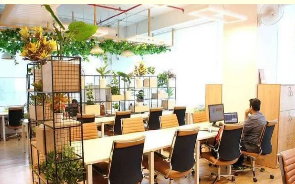
జూలై 16 (సందేశం టైమ్స్) : రియల్టీ సంస్థ బ్రిగేడ్ ఎంటర్ప్రైజెస్ లిమిటెడ్..

హైదరాబాద్ లో మరో ప్రతిష్టాత్మక ప్రాజెక్టును ప్రారంభించింది. హైటెక్ సమీపంలోని మైండ్ స్పేస్ బిజినెస్ పార్క్ వద్ద 50,000 చదరపు అడుగుల విస్తీర్ణంలో కో-వర్కింగ్ కేంద్రాన్ని అందుబాటులోకి తీసుకువచ్చింది. తన అనుబంధ సంస్థ బజ్ వర్క్ ద్వారా బ్రిగేడ్ ఎంటర్ప్రైజెస్ ఈ ప్రాజెక్ట్ చేపట్టింది. ఈ కో వర్కింగ్ కేంద్రంలో 1,000 మంది పని చేయవచ్చని ప్రకటించింది. కాగా కంపెనీ ఇప్పటికే హైటెక్ సిటీ సమీపంలోనే కో వర్కింగ్ సెంటర్ ను నిర్వహిస్తోంది.