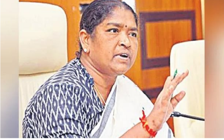
హైదరాబాద్, జూన్ 17(సందేశం టైమ్స్) : పట్టణ రోడ్లకు దీటుగా ప్రజలకు సౌకర్యంగా ఉండేలా.. హ్యూమ్(హైట్రైడ్ యాస్ఫుల్ట్ మోడల్)విధానంలో పల్లెరోడ్లు

నిర్మాణం చేపట్టనున్నట్లు పంచాయతీరాజ్, గ్రామీణాభివృద్ధి శాఖ మంత్రి సీతక్క తెలిపారు. సచివాలయంలో సంబంధిత అధికారులతో మంత్రి మంగళవారం సమీక్షించారు. ఈ సందర్భంగా ఆమె మాట్లాడుతూ.. హ్యూమ్ విధానంలో గ్రామీణ ప్రాంతాల రోడ్ల నిర్మాణానికి ఇటీవల జరిగిన కేబినెట్ సమావేశంలో ఆమోదం లభించిందని, ఈ ప్రాజెక్టుకు సంబంధించి మార్గదర్శకాలతో రెండు రోజుల్లో జీవో విడుదల చేస్తామన్నారు. %నాదీబీ% ఛానల్ ఫోల్డ్ అవ్వండి ఈ విధానం ద్వారా రాష్ట్రంలో 18,472 కిలోమీటర్ల మేర గ్రామీణ రహదారులను ఆధునికీకరిస్తామని తెలిపారు. అదేవిధంగా ఎంపీడీవోల బదిలీల పై సీఎం వద్ద ఉందని, వారికి సంబంధించిన వాహనాల భత్యం షెల్డ్ ఆర్డిక్ శాఖ వద్దకు చేరిందని, ఈ రెండు పైళ్లకు కొద్దిరోజుల్లో అనుమతి రానుందని మంత్రి సీతక్క వెల్లడించారు.