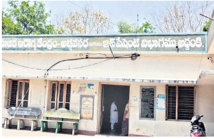
వైద్యసేవలు విస్తరణ దిశగా చర్యలు చేపడుతుంది రవికుమార్ పేర్కొన్నారు. అద్దంకికి డయాలసిస్, ఏఆర్టీ కేంద్రాలు మంజూరు చేసిన కేంద్ర, రాష్ట్ర ప్రభుత్వాలకు మంత్రి గొట్టిపాటి రవికుమార్ ధన్యవాదములు తెలిపారు.

అద్దంకి, అక్టోబరు 18 (సందేశం టైమ్స్): అద్దంకి నియోజకవర్గానికి డయాలసిస్, ఏఆర్టీ కేంద్రాలు మంజూరైనట్లు విద్యుత్ శాఖ మంత్రి గొట్టిపాటి రవికుమార్ తెలిపారు. కేంద్ర, రాష్ట్ర ప్రభుత్వాల సహకారంతో అద్దంకికి 5 బెడ్ల డయాలసిస్ సెంటర్, ఏఆర్టీ (యాంటీ రెట్రోవైరల్ ధెరఫీ కేంద్రం) మంజూరయ్యాయి. త్వరలో రెండు కేంద్రాలు ఏర్పాటు చేయనున్నట్లు తెలిపారు. డయాలసిస్ సెంటర్ ద్వారా కిడ్నీ రోగులకు, ఏఆర్టీ సెంటర్ ద్వారా హెచ్ఐవీ వ్యాధిగ్రస్తులకు మెరుగైన వైద్యసేవలు అందుబాటులోకి రానున్నాయి. రెండు కేంద్రాలకు సంబంధించి భవనాల నిర్మాణం, ఆధునిక వైద్య పరికరాలు, అవసరమైన ఇతర వసతులు కల్పించేందుకు చర్యలు చేపడుతున్నట్లు తెలిపారు. కిడ్నీ వ్యాధి తో బాధ పడుతున్న రోగులు ఇప్పటి వరకు ఒంగోలు, గుంటూరు తదితర పట్టణాలకు వెళ్ళాల్సి రావడంతో ఇబ్బంది పడుతున్నారు. అద్దంకిలో ఏర్పాటు కానున్న నేపథ్యంలో అద్దంకి నియోజకవర్గంలో పాటు దర్శి నియోజకవర్గంలోని పలు గ్రామాల కిడ్నీ రోగులకు అద్దంకి లోనే డయాలసిస్ చేయించుకునే అవకాశం ఏర్పడుతుంది. కూటమి ప్రభుత్వం ప్రజలకు నాణ్యమైన