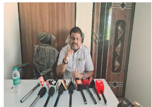
ఆరోపించారు. బీసీలను చిన్నచూపు చూస్తూ అన్యాయం చేస్తున్న ఈ పార్టీలకు బుద్ధి చెప్పాల్సిన అవసరం ఉందని విమర్శించారు.

చేస్తోందని పేర్కొన్నారు. రాహుల్ గాంధీ, పీసీసీ అధ్యక్షుడు మ హేష్ కుమార్ గౌడ్, ముఖ్యమంత్రి రేవంత్ రెడ్డి, వైద్య ఆరోగ్య శాఖ మంత్రి దామోదర రాజనర్సింహ, బీసీ మంత్రులు పొన్నం ప్రభాకర్, కొండా సురేఖ సహా ఇతర ఎమ్మెల్యేలు, ఎమ్మెల్సీలు అందరూ కలిసి కేంద్రాన్ని ఒప్పించి పార్లమెంటులో బిల్లు పెట్టించి 42 శాతం రిజర్వేషన్లను అమలు చేయించాలనే దిశగా ఉన్నారని తెలిపారు. ఇక బీఆర్ఎస్, బీజేపీలు మాత్రం బీసీలను మోసం చేస్తూ, కపట నాటకాలు ఆడుతున్నాయని