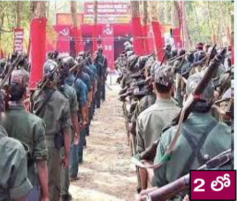
2 లో (సందేశం టైమ్స్): విజయవాడ పరిసర ప్రాంతాల్లో మావోయిస్టుల కదలికలు కలకలం రేపాయి.

అధికారులకు అందిన విశ్వసనీయ సమాచారం తీసుకున్న భవనంలో వీరి అనుమా నాస్పద ఆధారంగా కేంద్ర బలగాలు, ఆక్టోపస్, గ్రేహౌండ్స్ కదలికలు గమనించిన పోలీసులు గువ్త కలిసి నిర్వహించిన ప్రత్యేక ఆపరేషన్లో 27 మంది సమాచారం సేకరించి, తెల్లవారుజామున ప్రాం మావోయిస్టులను అదుపులోకి తీసుకున్నారు. తాన్ని ముట్టడి చేసి మెరుపుదాడి చేశారు. కానూరు కొత్త ఆటోనగర్లోని ఒక భవనాన్ని అరెస్టుయిన వారిలో 12 మంది మహిళలు, తాత్కాలిక స్థావరంగా మార్చుకుని కార్యకలాపాలు నలుగురు కీలక నాయకులు, అలాగే 11 మంది సాగిస్తున్న ఈ బృందాన్ని మంగళవారం ఉదయం అరెస్ట్ చేశారు. నిఘా వర్గాల సమాచారం ప్రకారం, ఛత్తీస్ గఢ్ కు చెందిన ఈ గుంపు సుమారు పది శివార్లలో నాలుగు ప్రాంతాల్లో ఆయుధాలు, రోజుల క్రిత వేచి కూలీ వసుల పేరిట పేలుడు పదార్థాలతో డంపెలు ఏర్పాటు విజయవాడకు చేరుకుంది. ఆటోనగర్లో అరెస్టు