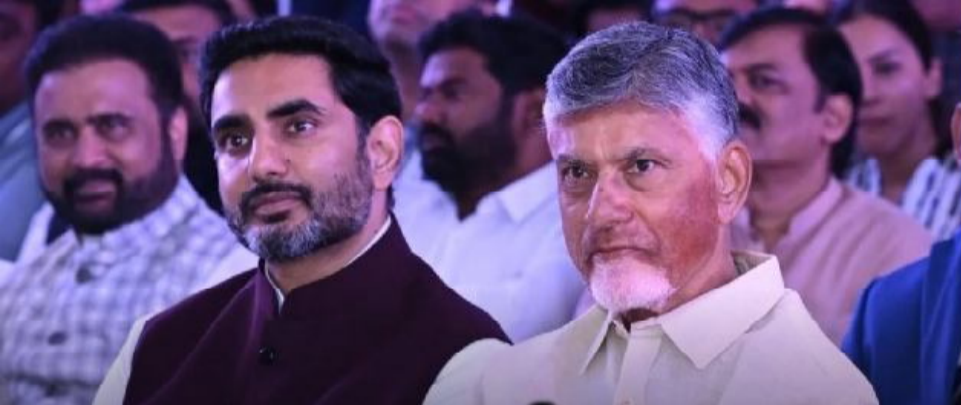
2 లో (సందేశం టైమ్స్): ఆంధ్రప్రదేశ్ ముఖ్యమంత్రి చంద్రబాబు, రాష్ట్ర ఐటీ, విద్యా శాఖ మంత్రి నారా లోకేశ్ బీహార్ పర్యటనకు వెళ్లనున్నారు.

బీహార్ ఎన్నికల్లో ఎన్డీయే కూటమి ఘనవిజయం ఎల్లుండి సీఎంగా నితీశ్ కుమార్ ప్రమాణస్వీకారం ఏపీ సీఎం చంద్రబాబు, మంత్రి లోకేశ్ లకు ఆహ్వానం