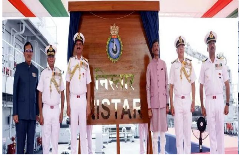
నౌక పొరుగు ప్రాంతాలలో కూడా సబ్మెరైన్ రెస్క్యూ ఆపరేషన్లలో సహాయం అందిస్తుందన్నారు. నౌకా నిర్మాణ రంగంలో భారత్ ఎదుగుదలకు నిస్సార్ ఓ నిదర్శనలా నిలుస్తుందన్నారు.

విశాఖపట్నం, జూలై 19(సందేశం టైమ్స్):అవధలో చిక్కుకున్న జలాంతర్గాములను రక్షించడానికి ఆధునిక పరిజ్ఞానంతో స్వదేశీయంగా నిర్మించిన 'ఐఎన్ఎస్ నిస్సార్' విశాఖపట్నం నేవల్ డాక్యూమెంట్ జలప్రవేశం చేసింది. రక్షణ శాఖ సహాయ మంత్రి సంజయ్ సేథ్ దీన్ని జలప్రవేశం చేయించారు. ఈ సందర్భంగా ఆయన మాట్లాడుతూ.. ఈ నౌకను లోతైన సముద్రంలో సహాయక కార్యకలాపాలు చేపట్టడానికి రూపొందించారన్నారు. ప్రపంచంలో కొన్ని దేశాల వద్దే ఇలాంటి ప్రత్యేక డైవింగ్ టీమ్ కలిగిన సహాయక నౌకలు ఉన్నాయని, అందులో భారత్ కూడా చేరడం గర్వకారణంగా ఉందని చెప్పారు. నౌకాదళం చీఫ్ అడ్మిరల్ దినేష్ త్రిపాఠి మాట్లాడుతూ.. ఈ డైవింగ్ సహాయక