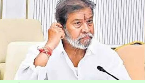
అక్టోబరు నెలాఖరు కల్లా నిర్మాణ పనులు పూర్తయ్యాలి అధికారులకు మంత్రి దామోదర రాజనర్సింహ ఆదేశం

హైదరాబాద్, సెప్టెంబరు 19 (సందేశం టైమ్స్): సనత్ నగర్ టిమ్స్ ఆస్తులను ఈ ఏడాది చివరి నాటికి ప్రజలకు అందుబాటులోకి తెచ్చేందుకు వీలుగా అక్టోబరు నెలాఖరుకు నిర్మాణ పనులు పూర్తి చేయాలని ఆర్ అండ్ బీ అధికారులను ఆరోగ్య శాఖ మంత్రి దామోదర రాజనర్సింహ ఆదేశించారు. ఈ మేరకు సనత్ నగర్, ఎల్పీ నగర్, కొత్తపేట టిమ్స్ ఆస్తులు, నిమ్మి ఆస్తుల విస్తరణ, వరంగల్ సూపర్ స్పెషాలిటీ హాస్పిటల్, వైద్య కళాశాల నిర్మాణ పనులపై ఆర్ అండ్ బీ, ఆరోగ్య శాఖ ఉన్నతాధికారులతో సచివాలయంలో శుక్రవారం ఆయన సమీక్ష నిర్వహించారు.