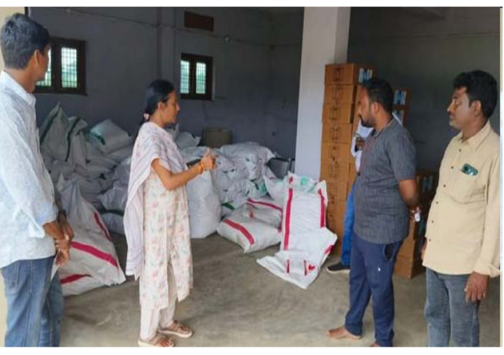
పూసపాటిరేగ (సందేశం టైమ్స్): మండల కేంద్రంలోని కొవ్వూడ రోడ్డు లేఅవుట్లో అక్రమంగా మొక్కజొన్న విత్తనాలు, కలుపు నివారణ మందులు నిల్వలను శనివారం వ్యవసాయ అధికారులు గుర్తించారు.

మండల వ్యవసాయశాఖ వీటిని శుక్రవారం వీటిని సీజ్ చేసింది. ప్రముఖ అడ్వాంటేజ్ కంపెనీకి సంబంధించిన మొక్కజొన్న విత్తనాలుగా గుర్తించారు. ఇదే పరిశ్రమ గతేడాదికూడా ఇదే విధంగా అక్రమంగా నిల్వచేసి రైతులకు పంపిణీ చేసినట్లు ఉన్న సమాచారంతో ఈ ఏడాది వ్యవసాయశాఖ దీనిపై దృష్టి సారించింది. గతేడాది రైతులు సాగు చేసిన మొక్కజొన్నపై తమకు ఈ కంపెనీ నుండి పండించిన పంటకు గిట్టుబాటు రాలేదని, కొంతమంది రైతులకు బకాయిలు ఉన్నాయని నెల రోజుల క్రితం గందరగోళం జరిగింది. వ్యవసాయశాఖ దీనిపై ఇటీవల విచారణ నిర్వహించడంతో పరిశ్రమకు చెందిన మధ్యవర్తులు కొంత నగదు రైతులకు జమచేసినట్లు సమాచారం. అయితే ఈ ఏడాదికూడా ఇదే పరిస్థితి కొనసాగుతుంటే పాటు అక్రమంగా పురుగుమందులు నిల్వచేయటంతో మండల వ్యవసాయశాఖ అధికారిణి సీలించి అక్కడకు చేరుకొని 2615కేజీల విత్తనాలు, 25 కేజీల కలుపు నివారణ కెమికల్ సీజ్ చేశారు. వీటి విలువ సుమారు రూ.9లక్షలుగా తెలిపారు. దీనిపై 6(ఎ) కేసును నమోదుచేస్తున్నట్లు తెలిపారు.