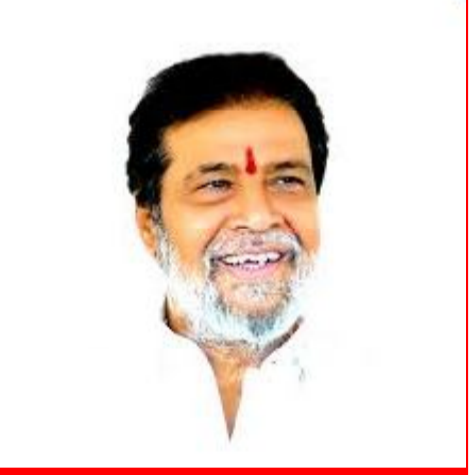
సందేశం టైమ్స్: సంగారెడ్డి నియోజకవర్గ ఇన్చార్జి : ఈ పవిత్రమైన పండుగ సందర్భంగా,

ప్రతి ఇంట్లో జ్ఞానం, సంతోషం, శ్రేయస్సు అనే వెలుగులు నిండాలని ఆయన ఆకాంక్షించారు. ప్రతి ఒక్కరూ ఆరోగ్యంగా, ఆనందంగా ఉండాలని ఆయన లక్ష్య దేవిని ప్రార్థించారు. ఈ పండుగ రాష్ట్ర ప్రజలందరికీ నూతన ఉత్సాహాన్ని, ఉల్లాసాన్ని అందించాలని మంత్రి పేర్కొన్నారు. పండుగ సందర్భంగా ప్రజలు బాణసంచా విషయంలో జాగ్రత్తలు తీసుకుని, సురక్షితంగా దీపావళిని జరుపుకోవాలని ఆయన విజ్ఞప్తి చేశారు. పిల్లల విషయంలో తల్లిదండ్రులు అత్యంత జాగ్రత్తగా వ్యవహరించాలని, బాంబులు కాల్చేటప్పుడు అప్రమత్తంగా ఉండాలని మంత్రి సూచించారు. పసి పిల్లలను టాపసులకు దూరంగా ఉంచాలని సూచించారు. దీపావళి నేపథ్యంలో అన్ని హాస్పిటల్లలో డాక్టర్లు, సిబ్బంది అప్రమత్తంగా ఉండాలని మంత్రి ఆదేశించారు. ముఖ్యంగా సరోజిని దేవి ఐ హాస్పిటల్, ఇతర హాస్పిటల్లలోని కంటి చికిత్స విభాగాల్లో డాక్టర్లు, సిబ్బంది 24 గంటలు అందుబాటులోని ఉండాలన్నారు. దురదృష్టవశాత్తూ ఎవరైనా కంటి గాయాలు, కాలిన గాయాలతో వస్తే, వారికి తక్షణమే చికిత్స అందించాలని ఆరోగ్యశాఖ ఉన్నతాధికారులను ఆదేశించారు. అవసరమైన మెడిసిన్, ఎక్స్ ప్లెమ్ టోట్ సద్దంగా ఉంచుకోవాలన్నారు.