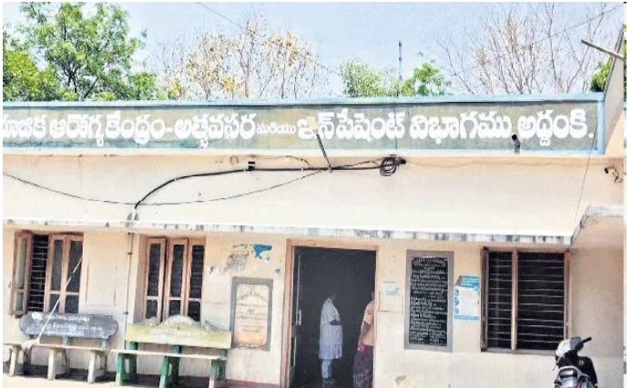
విస్తరణ దిశగా చర్యలు చేపడుతున్న రవికుమార్ పేర్కొన్నారు. అద్దంకికి డయాలసిస్, ఏఆర్టీ కేంద్రాలు మంజూరు చేసిన కేంద్ర, రాష్ట్ర ప్రభుత్వాలకు మంత్రి గొట్టిపాటి రవికుమార్ ?ధన్యవాదములు తెలిపారు.

అద్దంకి, (సందేశం టైమ్స్): అద్దంకి నియోజకవర్గానికి డయాలసిస్, ఏఆర్టీ కేంద్రాలు మంజూరైనట్లు విద్యుత్తాళి మంత్రి గొట్టిపాటి రవికుమార్ తెలిపారు. కేంద్ర, రాష్ట్ర ప్రభుత్వాల సహకారంతో అద్దంకికి 5 బెడ్ల డయాలసిస్ సెంటర్, ఏఆర్టీ(యాంటీ రెట్రోవైరల్ ధరఫీ కేంద్రం) మంజూరయ్యాయి. త్వరలో రెండు కేంద్రాలు ఏర్పాటు చేయనున్నట్లు తెలిపారు. డయాలసిస్ సెంటర్ ద్వారా కిడ్నీ రోగులకు, ఏఆర్టీ సెంటర్ ద్వారా హెచ్ఐవీ వ్యాధిగ్రస్తులకు మెరుగైన వైద్యసేవలు అందుబాటులోకి రానున్నాయి. రెండు కేంద్రాలకు సంబంధించి భవనాల నిర్మాణం, ఆధునిక వైద్య పరికరాలు, అవసరమైన ఇతర వసతులు కల్పించేందుకు చర్యలు చేపడుతున్నట్లు తెలిపారు. కిడ్నీ వ్యాధి తో బాధ పడుతున్న రోగులు ఇప్పటి వరకు ఒంగోలు, గుంటూరు తదితర పట్టణాలకు వెళ్ళాల్సి రావడంతో ఇబ్బంది పడుతున్నారు. అద్దంకిలో ఏర్పాటు కానున్న నేపథ్యంలో అద్దంకి నియోజకవర్గంలో పాటు దర్శి నియోజకవర్గంలోని పలు గ్రామాల కిడ్నీ రోగులకు అద్దంకి లోనే డయాలసిస్ చేయించుకునే అవకాశం ఏర్పడుతుంది. కూటమి ప్రభుత్వం ప్రజలకు నాణ్యమైన వైద్యసేవలు