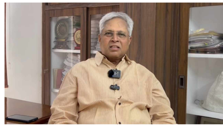
వైఫల్యంపై ప్రభుత్వం ఎందుకు విచారణ జరపడం లేదని నిలదీశారు. డి.డి.పీ ప్రభుత్వ హయాంలో జరిగిన తప్పిదం వల్లే దయాప్రం వాల్ దెబ్బతిందని గత

తరచూ ప్రాజెక్టును సందర్శించడం వల్ల పనులు వేగవంతం కాకపోగా, మరింత జాప్యం జరుగుతోందని ఆయన ఆరోపించారు. వారి పర్యటనల సమయంలో మొత్తం అధికార యంత్రాంగం అంతా వారి చుట్టూనే తిరగాల్సి వస్తోందని, ఇది పనులపై ప్రభావం చూపుతోందని అన్నారు. ఈరోజు రాజమండ్రిలో ఏర్పాటు చేసిన మీడియా సమావేశంలో ఉండవల్లి మాట్లాడారు. పోలవరంలో గతంలో దెబ్బతిన్న దయాప్రం వాల్ స్థానంలో కొత్తది నిర్మిస్తున్నారని, అయితే గతంలో రూ. 440 కోట్లతో దయాప్రం వాల్ విఫలం కాగా, అదే బావర్ కంపెనీకి ఇప్పుడు రూ. 990 కోట్లతో పనులు ఎలా అప్పగించారని ప్రశ్నించారు. ఈ