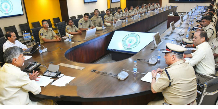
నేరాల రేటు 5.5 శాతం తగ్గిందని, ముఖ్యంగా మహిళలపై నేరాలు గణనీయంగా తగ్గముఖం పట్టాయని ఆయన వివరించారు. రాష్ట్రంలోని 16