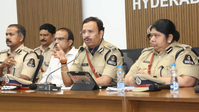
విధిగానే వెంటనే స్పందించేలా 'జీరో డిలే' విధానాన్ని మంత్రి పర్యవేక్షించి అమలు చేయాలని స్పష్టం చేశారు. నేరస్తులు ఒకచోట నేరం చేసి మరో కమిషనరేట్ పరిధిలోకి పారిపోతున్న ఘటనలను అరికట్టేందుకు ఈ చర్యలు చేపట్టారు. బంజారాహిల్స్ లోని ఇంటిగ్రేటెడ్ కమాండ్ అండ్ కంట్రోల్ సెంటర్ లో