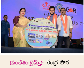
(సందేశం టైమ్స్): కేంద్ర పౌర

విమలయాన శాఖ మంత్రి కింజరపు రామ్మోహన్ నాయుడు విశాఖపట్టణంలోని ఒక హోటల్ లో ఆంధ్రప్రదేశ్ రాష్ట్రంలో తొలి సారిగా ప్రవేశపెట్టిన టూరిజం కారవాన్ - "శ్రీనివాస కారవాన్" కు సంబంధించిన పోస్టర్ మరియు ట్రోచర్ ను అధికారికంగా ఆవిష్కరించారు. ఈ కార్యక్రమం ఆంధ్రప్రదేశ్ టూరిజం శాఖ మరియు ఆంధ్రప్రదేశ్ టూరిజం డెవలప్ మెంట్ కార్పొరేషన్ సమన్వయంతో