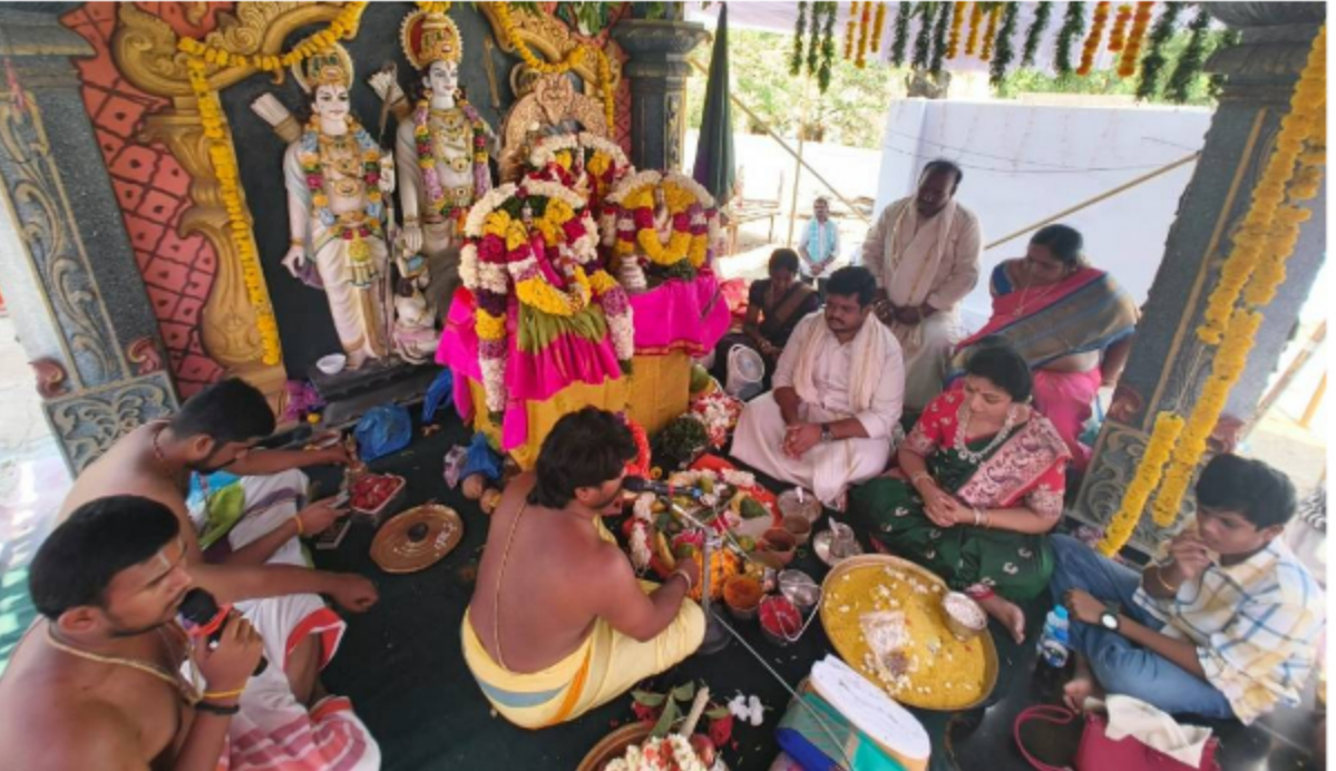
ఖమ్మం, సందేశం టైమ్స్ ప్రతినది, 28 మార్చి 2026: చింతకాని మండలం నాగులవంచ గ్రామంలోని పురాతన శ్రీ కోదండ రామాలయంలో శ్రీ సీతారామల కల్యాణ మహోత్సవం శుభవారం అత్యంత వైభవంగా, కన్నుల పండుగగా నిర్వహించబడింది. ఈ వివాహ మహోత్సవ వేడుకకు ముఖ్య అతిథులుగా