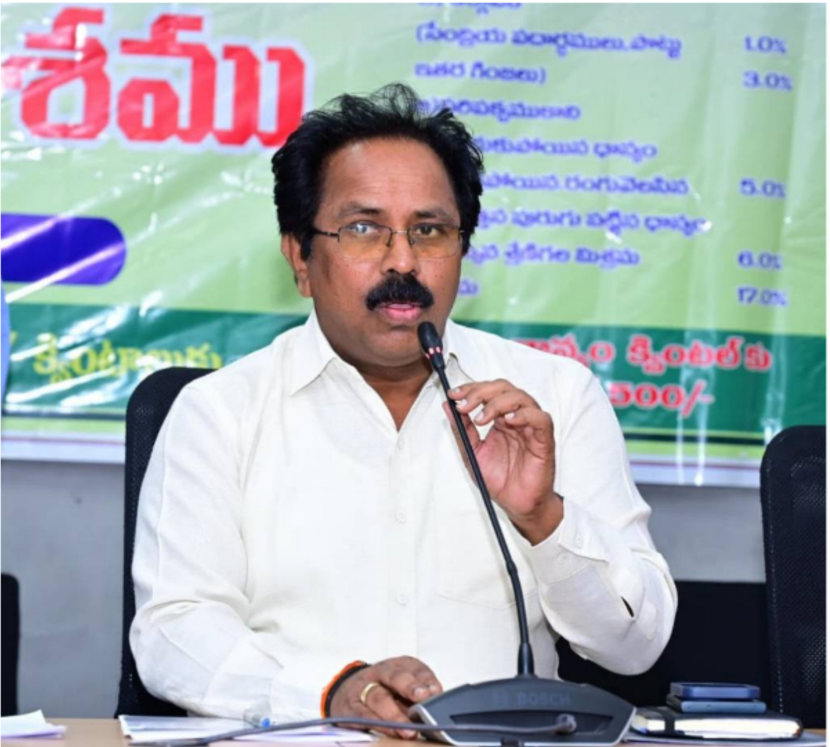
మెదక్ జిల్లా, సందేశం టైమ్స్ మెదక్ నియోజకవర్గం ప్రతినిధి, 02 ఏప్రిల్ 2026: మీసేవ కేంద్రాల ద్వారా అందించే వివిధ