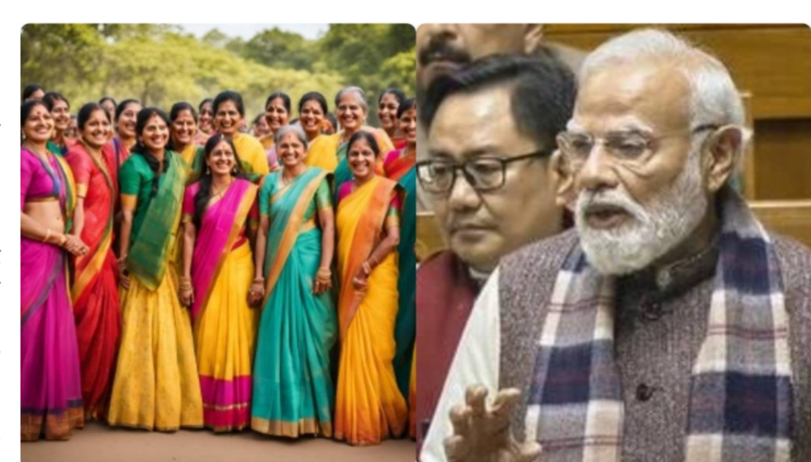
1994లోనే చారిత్రాత్మక నిర్ణయం తీసుకున్నాం

సమానత్వం పెరుగుతుందని, వారి ఆలోచనలు, నాయకత్వం దేశ అభివృద్ధికి దోహదపడుతాయని పేర్కొన్నారు. మహిళల కోసం విద్య, ఉపాధి, ఆరోగ్యం, భద్రత వంటి అంశాల్లో కూడా ప్రత్యేక చర్యలు చేపట్టామని తెలిపారు. గ్రామీణ ప్రాంతాల నుంచి పట్టణాల వరకు మహిళలకు అవకాశాలు విస్తరించేందుకు పలు సంక్షేమ పథకాలను అమలు చేస్తున్నామని వెల్లడించారు. స్వయం సహాయక సంఘాలు, చిన్న వ్యాపార ద్వారా మహిళల ఆర్థిక స్వావలంబన పెంచేందుకు ప్రత్యేక ప్రణాళికలు రూపొందించామని చెప్పారు. భవిష్యత్తులో కూడా మహిళల సాధికారత కోసం మరన్ని సంస్కరణలు తీసుకురావడమే తమ లక్ష్యమని స్పష్టం చేశారు. మహిళలు సమాజంలో కీలక పాత్ర పోషించాలంటే రాజకీయాల్లో వారి భాగస్వామ్యం మరింత పెరగాల్సిన అవసరం ఉందని అన్నారు. మహిళలకు ఇచ్చిన హామీలను నిలబెట్టుకోవడం తమ బాధ్యతగా భావిస్తూ, అన్ని రంగాల్లో వారికి సమాన హక్కులు, అవకాశాలు కల్పించే దిశగా ప్రభుత్వం కట్టుబడి ఉందని ఆయన పేర్కొన్నారు.