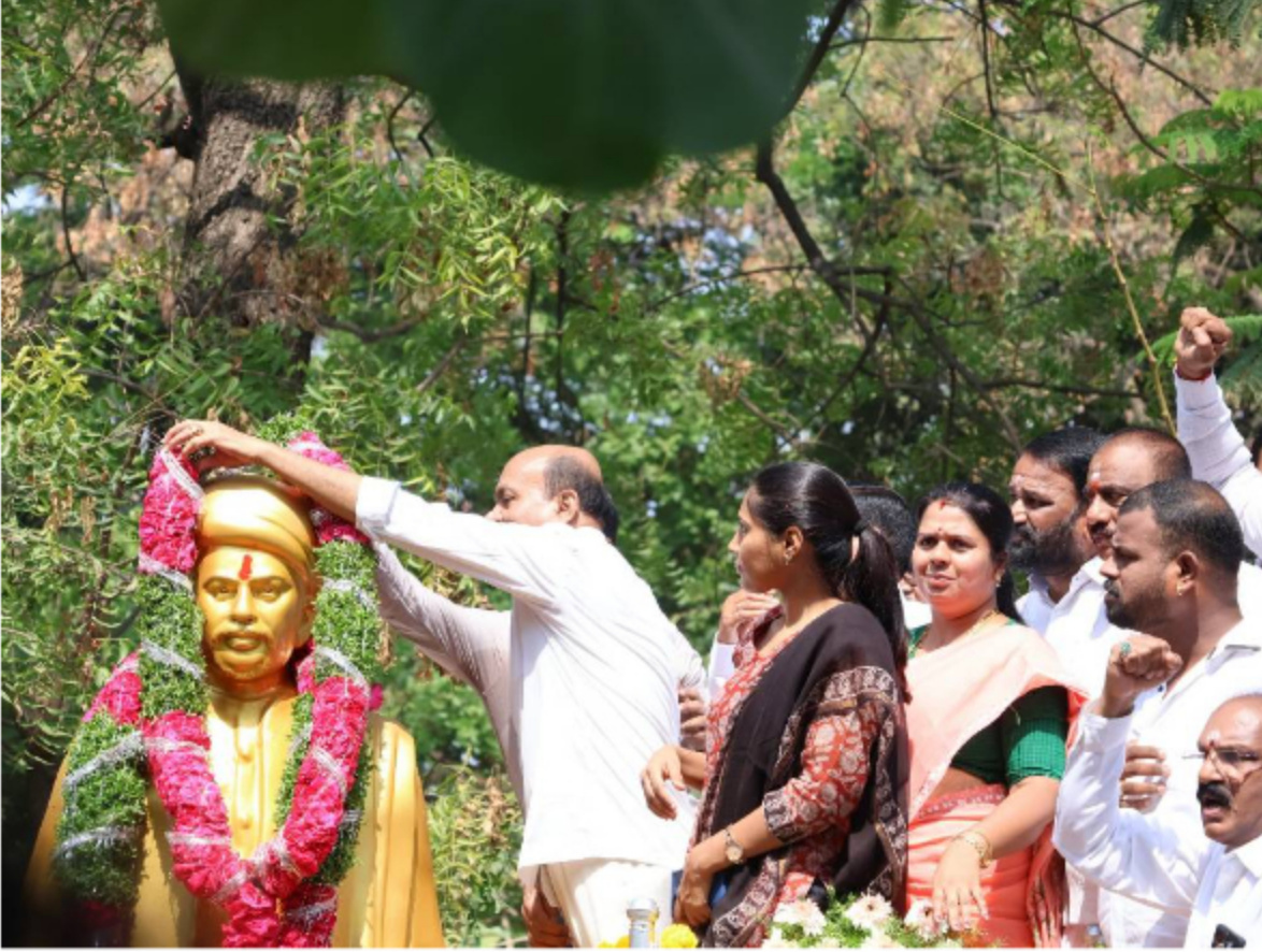
సందేశం టైమ్స్, సంగారెడ్డి, ఏప్రిల్ 12, ప్రతినీధి: మహానియు సామాజిక సంస్కర్త మహాత్మా జ్యోతిరావు పూలే జయంతిని సంగారెడ్డి జిల్లా కేంద్రంలో ఘనంగా నిర్వహించారు. ఈ సందర్భంగా ఎమ్మెల్యే క్యాంపు