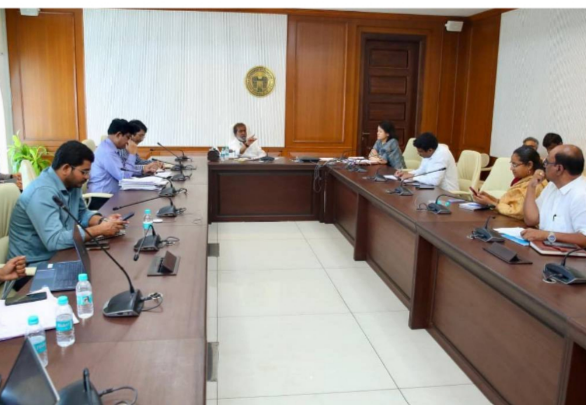
సందేశం టైమ్స్, హైదరాబాద్, ఏప్రిల్ 29, ప్రతినిధి: హైదరాబాద్ను ప్రపంచ స్థాయి వైద్య పర్యాటక

కేంద్రంగా అభివృద్ధి చేయాలని రాష్ట్ర ప్రభుత్వం సంకల్పించినట్లు ఆరోగ్యశాఖ మంత్రి దామోదర్ రాజనర్సింహ తెలిపారు. జూన్లో అంతర్జాతీయ మెడికల్ టూరిజం ఈవెంట్ నిర్వహించేందుకు ఏర్పాట్లు చేయాలని, పర్యాటకశాఖతో సమన్వయం సాధించాలని అధికారులను ఆదేశించారు. సెక్టోరియల్లో నిర్వహించిన సమీక్షలో దేశ, విదేశాల నుంచి ప్రతినిధులను ఆహ్వానించి ప్రభుత్వ ప్రాజెక్టులను ఆసుపత్రుల సందర్శనకు ఏర్పాట్లు చేయాలని సూచించారు. నిమ్స్, టిమ్స్, ఉస్మానియా, గాంధీ వంటి ప్రభుత్వ ఆసుపత్రుల్లో అంతర్జాతీయ రోగుల కోసం ప్రత్యేక విభాగాలు, వార్డులు ఏర్పాటు చేయాలని ఆదేశించారు. ప్రతి సంవత్సరం కనీసం ఒక మెడికల్ టూరిజం ఈవెంట్ నిర్వహించాలనే నిర్ణయాన్ని వెల్లడించిన మంత్రి, మే 12న 2322 నర్సింగ్ అఫిసర్లకు నియామక పత్రాలు అందజేయనున్నట్లు తెలిపారు. అలాగే అసిస్టెంట్ ప్రొఫెసర్, ఫార్మసిస్ట్, ఎంపిహెచ్ఎ పోస్టుల భర్తీ ప్రక్రియను వేగవంతం చేసి త్వరలో పూర్తి చేయాలని అధికారులను ఆదేశించారు.