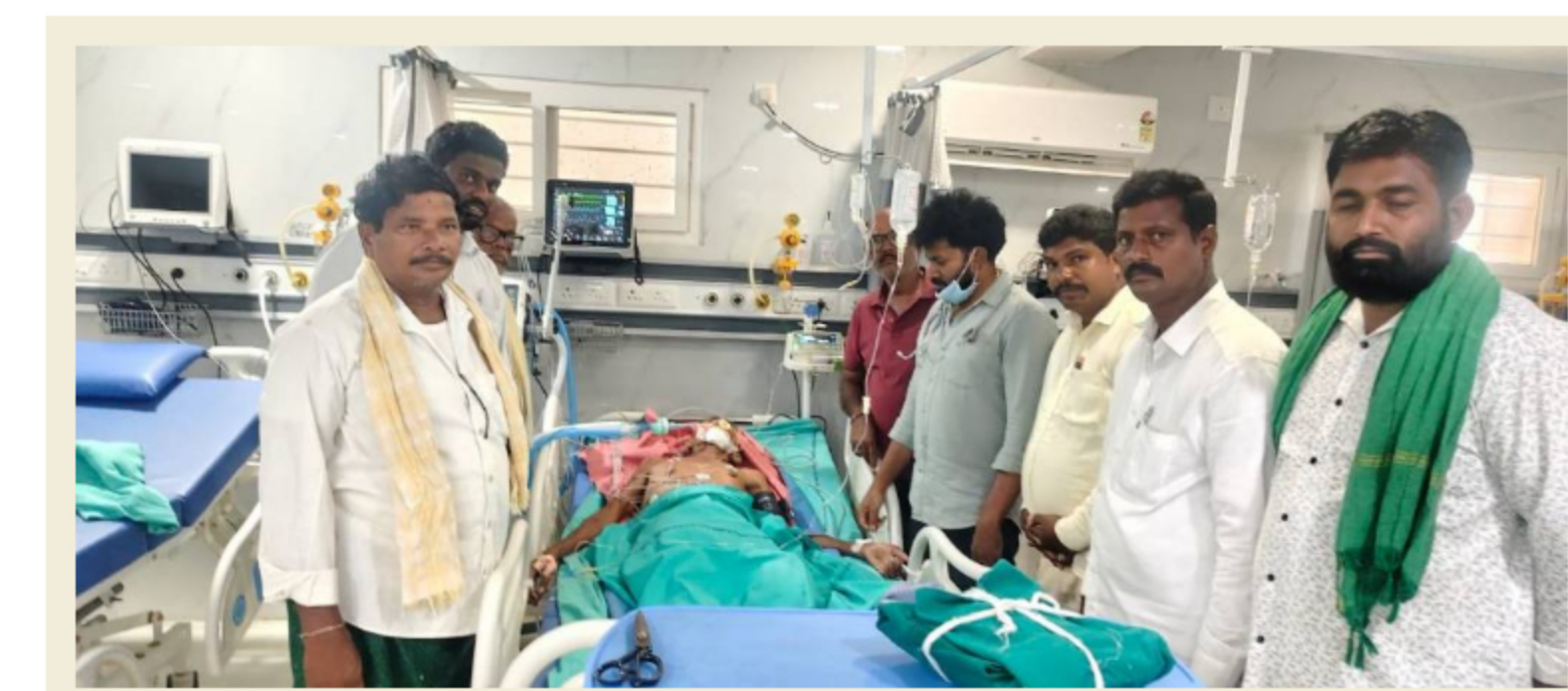
గౌడ సంఘం నాయకుల పరామర్శ - మెరుగైన వైద్యం అందించాలని వైద్యులను కోరిన నేతలు