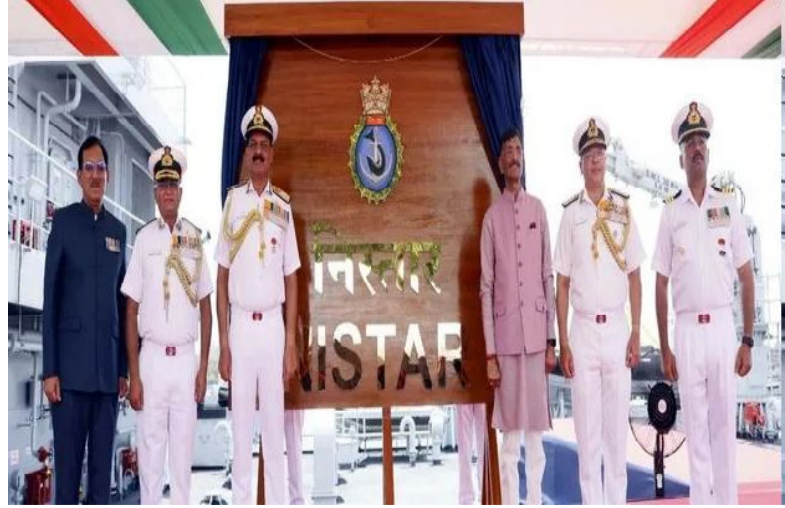
నౌక పొరుగు ప్రాంతాలలో కూడా సబ్మెరైన్ రెస్క్యూ ఆపరేషన్లలో సహాయం అందిస్తుందన్నారు. నౌకా నిర్మాణ రంగంలో భారత్ ఎదుగుదలకు నిస్సార్ ఓ నిదర్శనలా నిలుస్తుందన్నారు.

విశాఖపట్నం, జూలై 20 (సందేశం టైమ్స్):ఆవడలో చిక్కుకున్న జలాంతర్గాములను రక్షించడానికి ఆధునిక పరిజ్ఞానంతో స్వదేశీయంగా నిర్మించిన ‘ఐఎన్ఎస్ నిస్సార్’ విశాఖపట్నం నేవల్ డాక్యూమెంట్లో జలప్రవేశం చేసింది. రక్షణ శాఖ సహాయ మంత్రి సంజయ్ సేథ్ దీన్ని జలప్రవేశం చేయించారు. ఈ సందర్భంగా ఆయన మాట్లాడుతూ.. ఈ నౌకను లోతైన సముద్రంలో సహాయక కార్యకలాపాలు చేపట్టడానికి రూపొందించారన్నారు. ప్రపంచంలో కొన్ని దేశాల వద్దే ఇలాంటి ప్రత్యేక డైవింగ్ టీమ్ కలిగిన సహాయక నౌకలు ఉన్నాయని, అందులో భారత్ కూడా చేరడం గర్వకారణంగా ఉందని చెప్పారు. నౌకాదళం చీఫ్ అడ్మిరల్ దినేష్ త్రిపాఠి మాట్లాడుతూ.. ఈ డైవింగ్ సహాయక