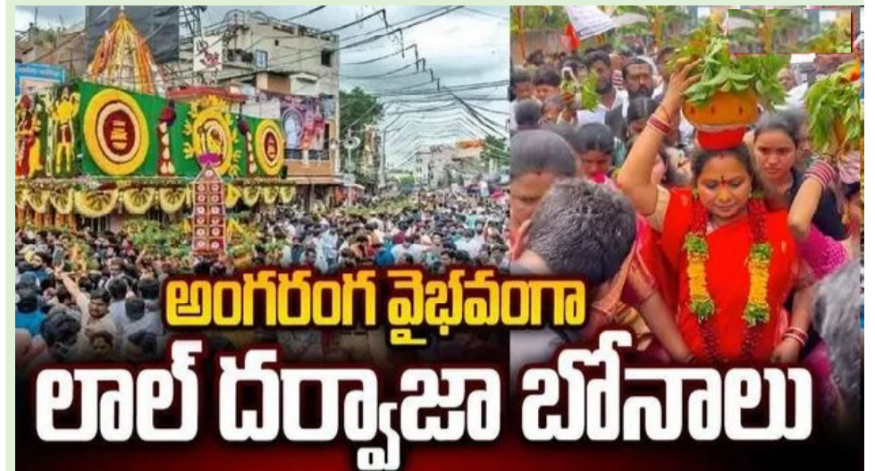
(సందేశం టైమ్స్) జూలై 20: హైదరాబాద్ లో బోనాల ఉత్సవాలు ఘనంగా సాగుతున్నాయి. ఈ నేపథ్యంలో కేంద్ర మంత్రి జి. కిషన్ రెడ్డి అంబర్ పేట