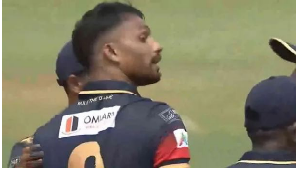
: ఏపీఎల్ లో భాగంగా మంగళవారం ఇక్కడ జరిగిన తొలి మ్యాచ్ లో భీమవరం బుల్స్ 27 పరుగుల తేడాతో కాకినాడ కింగ్స్ ను