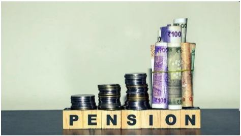
అర్హులమని భావిస్తే వెంటనే సమీప ఎంపీడీవో లేదా మునిసిపల్ కమిషనరీ కార్యాలయాలకు వెళ్లి అప్లికేషన్లు చేసుకోవాలి.

అమరావతి, ఆగస్టు 20 (సందేశం టైమ్స్) దివ్యాంగ పెన్షన్లకు అప్లికేషన్లు చేసుకునేందుకు ప్రభుత్వం మరోసారి అవకాశం కల్పించింది. తాము పెన్షన్లకు అర్హులమని భావించే దివ్యాంగులు వెంటనే దరఖాస్తు చేసుకునే వెసులుబాటు కల్పిస్తున్నట్లు వైద్య ఆరోగ్యశాఖ సెకండరీ హెల్త్ డైరెక్టర్ ఒక ప్రకటన ద్వారా తెలిపారు. పెన్షన్లకు అనర్హులుగా నోటీసు అందుకున్న వారు, తాము