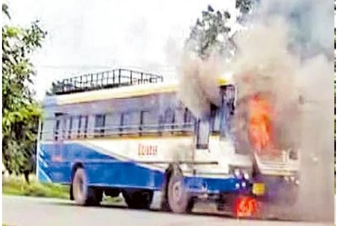
చెలరేగాయి. అప్రమత్తమైన డ్రైవర్ తిప్పును నిలిపివేసి, ప్రయాణికులను దించేశారు. దీంతో పెనుప్రమాదం తప్పింది.

ఆగస్టు 20 (సందేశం టైమ్స్) ఆర్టీసీ బస్సులో మంటలు వెలరేగిన సంఘటన కర్నూలు జిల్లాలో చోటుచేసుకుంది. ఆదోని డిపోకు చెందిన సింగిల్ స్టాప్ బస్సు ఉదయం కర్నూలు బయల్దేరింది. గోనగండ్ల ఎస్సీ కాలనీకి చేరుకున్న సమయంలో డ్రైవర్ దగ్గర బ్యానెట్ నుంచి మంటలు