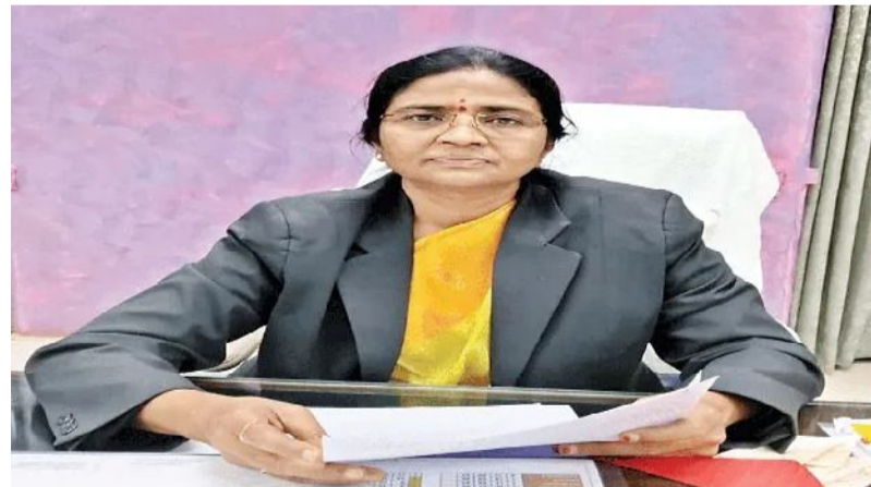
ఏలూరు క్రెం, ఆగస్టు 20 (సందేశం టైమ్స్)ఉమ్మడి పశ్చిమ గోదావరి జిల్లాలోని కోర్టులలో పలు పోస్టులకు దరఖాస్తు చేసుకున్న వారికి ఈనెల 20 నుంచి