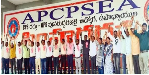
కార్యదర్శి, ఆర్థికశాఖ ముఖ్యకార్యదర్శి, ట్రెజరీ, ఆకౌంట్స్ డైరెక్టరేట్, పీ అండ్ ఆకౌంట్స్ ఆఫీసర్, వర్క్ ఆకౌంట్స్ డైరెక్టరీ నోటీసులు జారీ చేసింది. పిటిషన్లపై పూర్తిస్థాయి విచారణ జరిపేందుకు కొంటర్ అవసరమని అభిప్రాయపడింది.

అమరావతి, ఆగస్టు 20 (సందేశం టైమ్స్) వైసీపీ హయాం నుంచి పెండింగ్లో ఉన్న కరువు భత్యం(డీఏ), 11వ వేతన సంఘం(పీఆర్సీ) బకాయిలను చెల్లించేలా ప్రభుత్వాన్ని ఆదేశించాలని కోరుతూ కాంట్రీబ్యూటరీ పెన్షన్ స్కీమ్ ఉద్యోగుల సంఘం(ఏపీసీపీఎస్ ఈఎ) హైకోర్టును ఆశ్రయించింది. దీనిపై విచారణ జరిపిన న్యాయస్థానం కొంటర్ దాఖలు చేయాలని రాష్ట్ర ప్రభుత్వాన్ని ఆదేశించింది. ప్రభుత్వ ప్రధాన