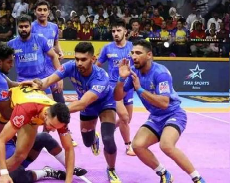
9 మ్యాచ్ లో టైటాన్స్ కిది నాలుగో గెలుపు. మరో మ్యాచ్ లో హరియాణా 34-30తో పుణెర్ పల్లెన్ కు షాకిచ్చింది.

జైపూర్: ఈ సీజన్ ప్రా కలడ్ టీమ్ లో వరుస వైఫల్యాలతో నిరాశపరుస్తున్న టైటాన్స్ కు ఊరట లభించింది. వరుసగా మూడు ఓటముల అనంతరం విజయాన్ని నమోదు చేసింది. శుక్రవారం జరిగిన మ్యాచ్ లో టైటాన్స్ 43-29తో తమిళ్ తలైవాసను చిత్తు చేసింది. ఓవరాల్ గా