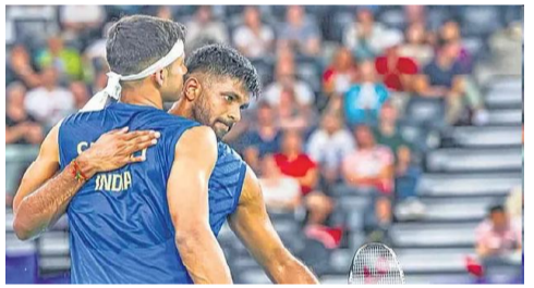
షెన్ జెన్ (చైనా): గతవారం హాంకాంగ్ ఓపెన్ లో రన్నర్స్ పునల్తోనే తన పోరాటాన్ని ముగించింది. సింధు 14-21, 13-21తో టాప్ సీడ్, ఒలింపిక్ చాంపియన్ అన్ సే యింగ్ (కొరియా) చేతిలో పరాజయం పాలైంది. ఇక 8వ సీడ్ సాత్విక్/చిరాగ్ ధ్యయం 21-14, 21-14తో చైనా జంట రెన్ గ్వియాంగ్ యు/గ్వి హోవాన్ ను ఓడించింది. శనివారం జరిగే సెమీ ఫైనల్ లో రెండో సీడ్, షెట్టి జోడీ వరుసగా రెండో టోర్నిలోనూ సత్తా మలేసియా జంట ఆరోన్ చియా/సో వూయి చాటుతోంది. ఈ భారత జంట చైనా మాస్టర్స్ లో యిక్తో అమీతుమీ తేల్చుకోనుంది.

సెమీఫైనల్ కు దూసుకెళ్లింది. ఇక, సింగిల్స్ ఏన్ షట్టి పీవీ సింధు మరోసారి నిరాశపరుస్తూ క్వార్టర్ ఫైనల్ తోనే తన పోరాటాన్ని ముగించింది. సింధు 14-21, 13-21తో టాప్ సీడ్, ఒలింపిక్ చాంపియన్ అన్ సే యింగ్ (కొరియా) చేతిలో పరాజయం పాలైంది. ఇక 8వ సీడ్ సాత్విక్/చిరాగ్ ధ్యయం 21-14, 21-14తో చైనా జంట రెన్ గ్వియాంగ్ యు/గ్వి హోవాన్ ను ఓడించింది. శనివారం జరిగే సెమీ ఫైనల్ లో రెండో సీడ్, షెట్టి జోడీ వరుసగా రెండో టోర్నిలోనూ సత్తా మలేసియా జంట ఆరోన్ చియా/సో వూయి చాటుతోంది. ఈ భారత జంట చైనా మాస్టర్స్ లో యిక్తో అమీతుమీ తేల్చుకోనుంది.