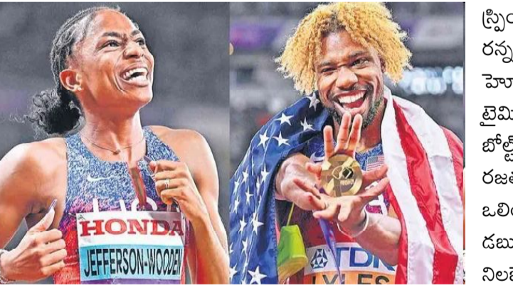
టోక్యో: అమెరికా స్టార్ నోవా లైట్స్ జమైకా దిగ్గజ స్ప్రింటర్ ఉ సేస్ బోల్ట్ రికార్డును సమం చేశాడు. ప్రపంచ అథ్లెటిక్స్ చాంపియన్ షిప్ లో లైట్స్ వరుసగా నాలుగోసారి 200 మీటర్ల

స్ప్రింట్ లైట్ లో కొల్లగొట్టాడు. పారిస్ ఒలింపిక్స్ ఫైనల్ లో తలపడిన ఎనిమిదిమంది రన్నర్లు బరిలో దిగడంతో శుక్రవారంనాటి ప్రపంచ అథ్లెటిక్స్ 200 మీ. ఫైనల్ హైరాహోరీగా సాగింది. కానీ అందరినీ వెనక్కువెట్టిన నోవా 19.52 సె. లైమింగ్ తో స్వర్ణం గెలిచాడు. దాంతో గతంలో ఈ ఫీట్ సాధించిన జమైకా గ్రేట్ బోల్ట్ సరసన లైట్స్ చేరాడు. అమెరికాకే చెందిన కెన్నీ బెడ్నర్ (19.58 సె.), రజతం, జమైకా రన్నర్ కెన్నీ లెవెల్ (19.64 సె.) కాంస్యం చేజిక్కించుకున్నారు. ఒలింపిక్ చాంపియన్ లెస్లీ బెటెగో నాలుగో స్థానంలో నిలిచాడు. మెలిస్సా గోల్డెన్ డబుల్: గత పోటీల మహిళల 200 మీ. విజేత పెరికా జాక్సన్ (జమైకా) లైట్ లో నిలబెట్టుకోలేకపోయింది. 22.18 సె. లో గమ్యం చేరిన పెరికా కాంస్యానికే పరిమితమైంది. మెలిస్సా జఫర్సన్ ఉడెన్ (21.66 సె.) స్వర్ణం సొంతం చేసుకోగా, అమీ హంట్ (బ్రిటన్-22.14 సె.) రజతం సాధించింది. ఈసారి 100 మీ. స్ప్రింట్ లోనూ లైట్ లో అందుకున్న జఫర్సన్ 200 మీ. లైట్ లోతో 'గోల్డెన్' డబుల్ సాధించింది.