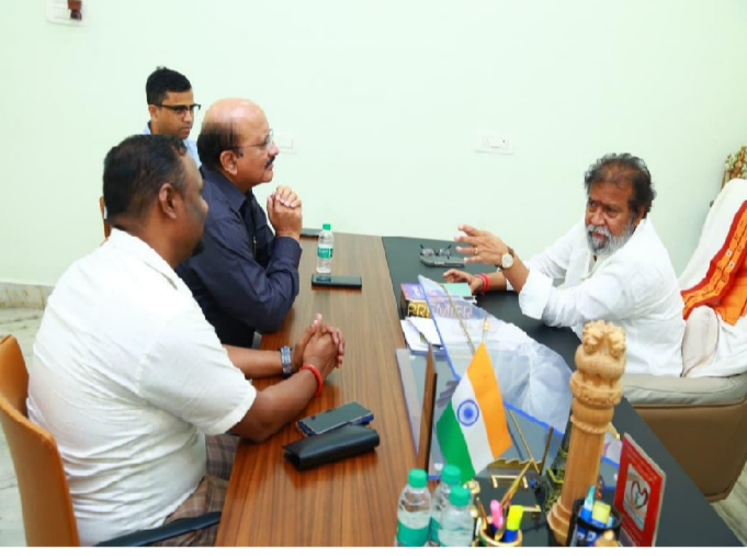
సందేశం టైమ్స్ : నారాయణఖేడ్ ప్రతినిధి 20సెప్టెంబర్: హైదరాబాద్ లోని మినిస్టర్స్ క్వార్టర్స్ లో ఆరోగ్యశాఖ మంత్రి దామోదర్ రాజనర్సింహ గారిని కలిసిన ఆరోగ్యశ్రీ నెట్వర్క్ హాస్పిటల్స్ అసోసియేషన్ ప్రతినిధులు, పలు అంశాలపై చర్చించి, రేపటి నుంచే ఆరోగ్యశ్రీ సేవలను యథావిధిగా కొనసాగిస్తామని హామీ ఇచ్చారు. ఈ సందర్భంగా మంత్రి దామోదర్