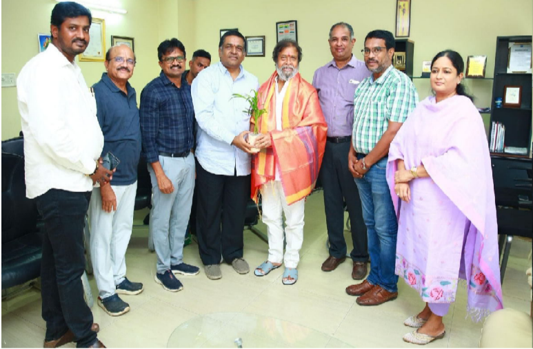
రాజనర్సింహ మాట్లాడుతూ, "పేద ప్రజలకు నాణ్యమైన వైద్య సేవలు అందించడంలో ఆరోగ్యశ్రీ నెట్వర్క్ హాస్పిటల్స్ కీలక పాత్ర పోషిస్తున్నాయి. ప్రభుత్వానికి సహకరిస్తున్న ఈ హాస్పిటల్స్ సేవలను అభివృద్ధి చేస్తాం," అని ప్రశంసలు కురిపించారు. అసోసియేషన్ ప్రతినిధులు మంత్రికి తమ సమస్యలను వివరించగా, మంత్రి సానుకూలంగా స్పందించారు. ప్రతి నెలా