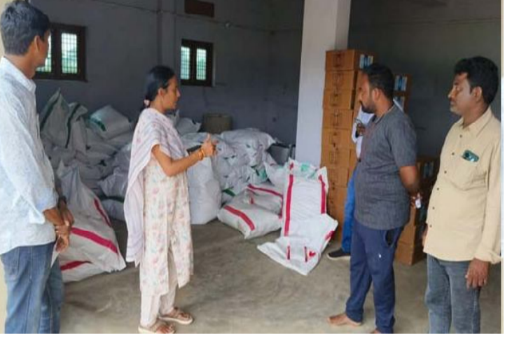
పూసపాటిగ (సందేశం టైమ్స్): మండల కేంద్రంలోని కొవ్వొత్తు రోడ్డు లేఅవుట్లో అక్రమంగా మొక్కజొన్న విత్తనాలు, కలుపు నివారణ మందులు నిల్వలను శనివారం వ్యవసాయ అధికారులు గుర్తించారు.

మండల వ్యవసాయశాఖ వీటిని శుక్రవారం వీటిని సీజ్ చేసింది. ప్రముఖ అడ్వాంటేజ్ కంపెనీకి సంబంధించిన మొక్కజొన్న విత్తనాలుగా గుర్తించారు. ఇదే పరిశ్రమ గతేడాదికూడా ఇదే విధంగా అక్రమంగా నిల్వచేసి రైతులకు పంపిణీ చేసినట్లు ఉన్న సమాచారంతో ఈ ఏడాది వ్యవసాయశాఖ దీనిపై దృష్టి సారించింది. గతేడాది రైతులు సాగు చేసిన మొక్కజొన్నపై తమకు ఈ కంపెనీ నుండి పండించిన పంటకు గిట్టుబాటు రాలేదని, కొంతమంది రైతులకు బకాయిలు ఉన్నాయని నెల రోజుల క్రితం గందరగోళం జరిగింది. వ్యవసాయశాఖ దీనిపై ఇటీవల విచారణ నిర్వహించడంతో పరిశ్రమకు చెందిన మధ్యవర్తులు కొంత నగదు రైతులకు జమచేసినట్లు సమాచారం. అయితే ఈ ఏడాదికూడా ఇదే పరిస్థితి కొనసాగుతుంటే పాటు అక్రమంగా పురుగుమందులు నిల్వచేయటంతో మండల వ్యవసాయశాఖ అధికారిణి సీలింపు అక్కడకు చేరుకొని 2615కేజీల విత్తనాలు, 25 కేజీల కలుపు నివారణ కెమికల్ సీజ్ చేసారు. వీటి విలువ సుమారు రూ.9లక్షలుగా తెలిపారు. దీనిపై 6(ఎ) కేసును నమోదుచేస్తున్నట్లు తెలిపారు.