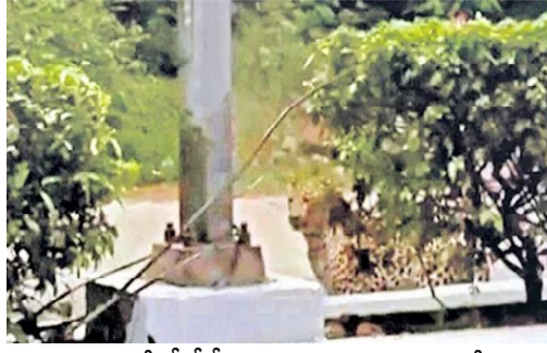
సమాచారంతో టీటీడీ భక్తులను అప్రమత్తం చేసింది.

తిరుమల,(సందేశం టైమ్స్): తిరుపతిలోని అలిపిరి తనిఖీ కేంద్రం నమీపంలో తెల్లవారుజామున ఒక చిరుత చక్కర్లు కొట్టింది. తిరుమల రెండో ఫూట్ రోడ్డులో అలిపిరి టోల్గేట్ కి వంద మీటర్ల దూరంలో 3 గంటల సమయంలో చిరుత రోడ్డుపైకి వచ్చింది. తిరుమలకు వెళుతున్న వాహనదారులు చిరుతను రోడ్డుపై చూసి షాకయ్యారు. ఈ సమాచారంతో టీటీడీ భక్తులను అప్రమత్తం చేసింది.