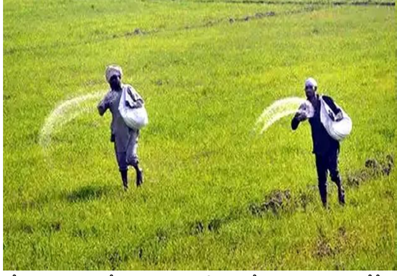
వీరికి తాత్కాలిక పదోన్నతులు కల్పించి, పోస్టులు కేటాయిస్తూ ప్రభుత్వం వేర్వేరు ఉత్తర్వులు జారీ చేసింది.