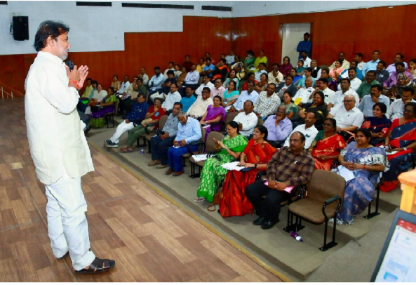
సందేశం టైమ్స్: నారాయణాశ్రీ ఇంచార్జి నవంబర్ 20 అనారోగ్యంతో ఇబ్బంది పడుతున్న వృద్ధుల వివరాలతో జాబితాలు సిద్ధం చేసుకోవాలని డీఎంహెచ్ఎల్కు సూచన