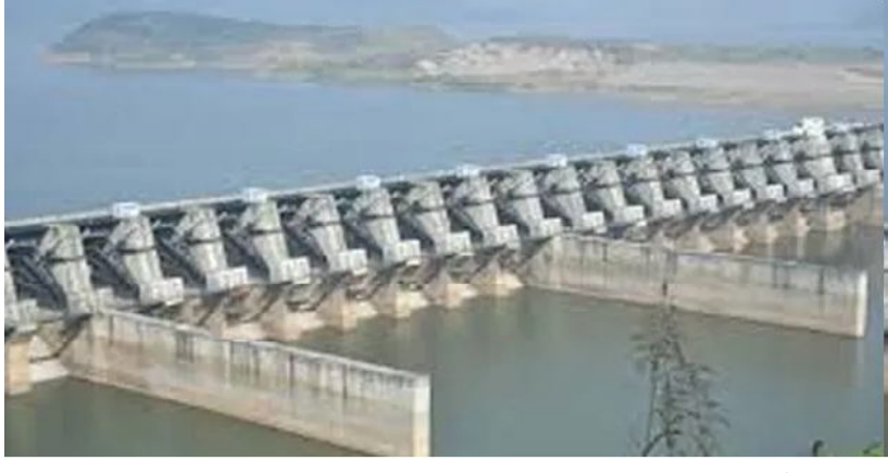
నిర్ణయించింది. కాగా, పోలవరం ప్రాజెక్టు బృందం ఆదివారం రాజమండ్రికి చేరుకుంది. సోమవారం పోలవరం ప్రాజెక్టు ప్రాంతంలో ఈ బృందం పర్యటించి, జలాలపై అధ్యయనం చేయనుంది.