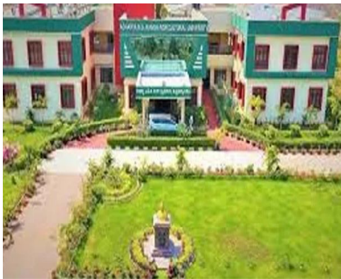
అమరావతి, జూలై 21 (సందేశం టైమ్స్): ఆచార్య ఎన్టీ రంగా వ్యవసాయ విశ్వవిద్యాలయం నిర్వహించే అగ్రికల్చర్ డిప్లొమా కోర్సులకు ఆన్ లైన్ లో దరఖాస్తు చేసుకున్న అభ్యర్థులు వెబ్ ఆప్షన్లు సమోదు చేసుకోవటానికి ఆఖరి తేదీని ఈనెల 25 వరకు