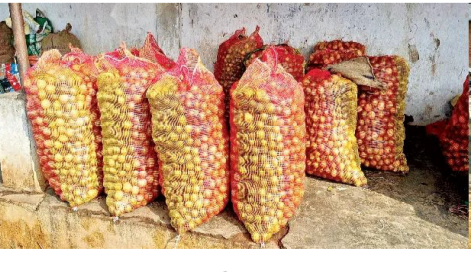
పెరిగింది. వాటిని కొనేందుకు మైదాన ప్రాంత వ్యాపారులు పోటీ పడ్డారు. గత వారం 45కేజీల నిమ్మకాయల బస్తా ధర రూ. 450లు ఉండగా.. నేడు రూ. 750కు చేరింది. ఒక్కసారిగా ధర పెరగడంతో గిరిజన రైతులు హర్షం వ్యక్తం చేస్తున్నారు. తమ కష్టానికి తగ్గ ప్రతిఫలం లభించిందనే సంతోషంతో ఇంటిదారి పట్టారు.

సీతంపేట రూరల్, జూలై 21 (సందేశం టైమ్స్): ఏజెన్సీలో గిరిజన రైతులు సేకరించే అటవీ ఉత్పత్తుల్లో నిమ్మ పంట ఒకటి. అయితే గడిచిన కొద్ది వారాలుగా నిమ్మకాయలకు అశించిన స్థాయిలో మద్దతు ధర రాలేదు. దీంతో గిరిజన రైతులు ఆవేదన చెందారు. ప్రస్తుతం సీన్ మారింది. సీతంపేట వారపు సంతలో నిమ్మకాయలకు డిమాండ్