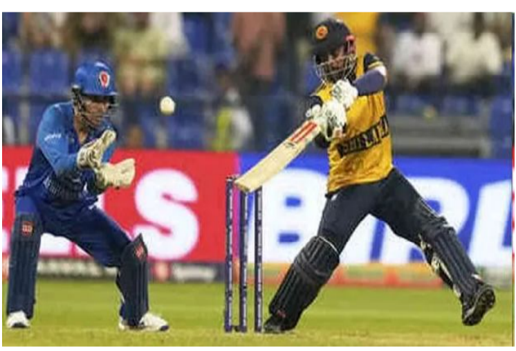
రిషాద్ రాజీస్తుండడం సానుకూలం.

దుబాయ్: ఆసియా కప్ టీ20 బోర్నిలో శనివారం సూపర్-4 పోరుకు తెర లేపనుంది. గ్రూప్ 'ఎ' నుంచి భారత్, పాకిస్తాన్.. గ్రూప్ 'బి' నుంచి శ్రీలంక, బంగ్లాదేశ్ జట్లు ఇందుకు అర్హత సాధించిన విషయం తెలిసింది. సూపర్-4లో ప్రతి జట్టు ఇతర మూడు జట్లతో ఆడాల్సి ఉంటుంది. ఈనెల 26 వరకు మొత్తం ఆరు మ్యాచ్లు జరుగునుండగా, టాప్-2లో నిలిచిన జట్టు 28న దుబాయ్ లో జరిగే ఫైనల్లో తలపడతాయి. ముందుగా శ్రీలంక-బంగ్లాదేశ్ జట్ల మధ్య తొలి మ్యాచ్ జరుగునుంది. ఆడిన మూడు మ్యాచ్లలో నెగ్గి లంక ఊపు మీదుంది. ఓపెనర్ నిస్సాంక, మెండీస్ ఫామ్ లో ఉన్నారు. అయితే మిడిలార్డర్ పుంజుకోవాల్సి ఉంది. అటు బంగ్లాదేశ్ జట్టు లంకపై గ్రూప్ దశలో ఎదురైన ఓటమికి ఈసారి బదులు తీర్పుకోవాలనుకుంటోంది. లిట్టన్ దాస్, డ్రాడయ్ బ్యాటింగ్లో కీలకం కానుండగా.. స్పిన్నర్లు తన్జీమ్,