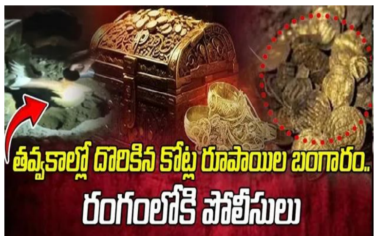
ఉన్మాయని పోలీసుల విచారణలో వెల్లడైనట్లు తెలుస్తోంది. ఒక్కో బిళ్ల 23 గ్రాముల బరువు ఉందని పోలీసులకు వారు వివరించినట్లు సమాచారం. దీనిపై పోలీసులు సమగ్ర విచారణ జరుపుతున్నారు.

ములుగు, నవంబరు21(సందేశం టైమ్స్): గుప్త నిధుల తవ్వకాల్లో భారీగా బంగారం లభించింది. దానిని పంచుకునే క్రమంలో వారి మధ్య విభేదాలు వచ్చాయి. దాంతో ఈ పంచాయతీ కాన్వే పోలీస్ స్టేషన్ కు చేరింది. పోలీసులు రంగంలోకి దిగి.. బదుగురు వ్యక్తులను అదుపులోకి తీసుకుని విచారిస్తున్నారు. ఈ ఘటన ములుగు జిల్లాలో చోటు చేసుకుంది. ఆరు నెలల క్రితం కొందరు వ్యక్తులు బృందంగా ఏర్పడి.. మహారాష్ట్రలోని సిరిపంచ సమీపంలో ఒక ఇంట్లో గుప్త నిధుల కోసం భారీ ఎత్తున తవ్వకాలు జరిపారు. ఈ సందర్భంగా రాగి బిందెను వారు వెలికి తీశారు. అందులో భారీ ఎత్తున బంగారం లభ్యమైంది. %దొరికిన ఆ బంగారాన్ని పంచుకునే క్రమంలో ఈ బృందంలోని సభ్యుల మధ్య విభేదాలు తలెత్తాయి. ఒకరికొకరు ఘర్షణకు దిగారు. ఈ పంచాయతీ పోలీసులకు చేరింది. వీరి నుంచి మొత్తం సమాచారాన్ని సేకరించేందుకు పోలీసులు రంగంలోకి దిగారు. గుప్త నిధుల తవ్వకాల్లో దొరికిన రాగి బిందెపై పోలీసులు ఆరా తీశారు. ఈ తవ్వకాల్లో దొరికిన బిందెలో మొత్తం 36 బంగారం బిళ్లలు