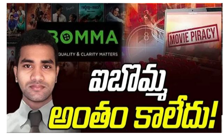
నేరగాళ్లు ఇప్పటికే ఉన్న వెబ్సైట్లకు ఐబిఎమ్ పేరు మార్చి.. వాటిపై క్లిక్ చేస్తే తమ పేజీకి రిడైరెక్ట్ అయ్యేలా చేస్తున్నారు.