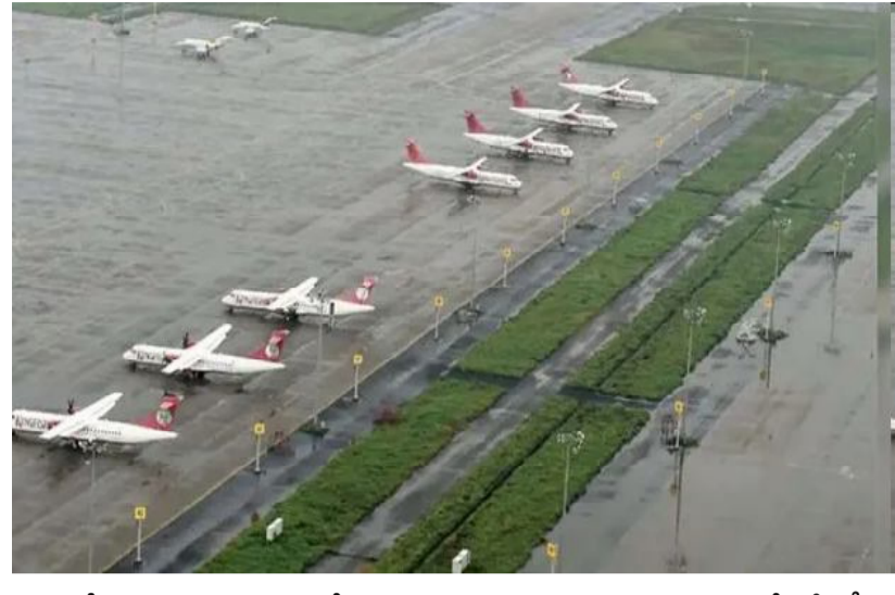
న్యూఢిల్లీ, జూలై 22 (సందేశం టైమ్స్): చిత్తూరు జిల్లా కుప్పంలో గ్రీన్ ఫీల్డ్