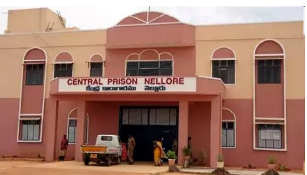
నెల్లూరు(కైం) సెప్టెంబర్ 22 (సందేశం టైమ్స్): నెల్లూరు కేంద్ర కారాగారంలో అధికారులు, సిబ్బంది పనితీరుపై రోజురోజుకూ విమర్శలు తీవ్రమవుతున్నాయి. ఇటీవల ఓ ఉన్నతాధికారి