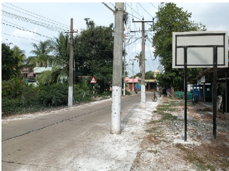
నరసాపురం సెప్టెంబర్ 22 (సందేశం టైమ్స్): మండలంలోని ఎల్బి చర్ల గ్రామం లైన్ పాతం సెంటర్ లో సీసీ రోడ్డు మధ్యలో ప్రమాదకరంగా

మూడు విద్యుత్ స్తంభాలు ఉన్నాయి. ఇటీవల లక్షణేశ్వరం నుండి తూర్పుతూట్ల వరకూ సూతనంగా సీసీ రోడ్డు నిర్మించారు. అయితే రోడ్డు మధ్యలో స్తంభాలు మరిచారు. ఈ రోడ్డు మార్గంలో వెళ్లే రోడ్డు మధ్యలో పలు కరెంట్ స్తంభాలు దర్భనమిస్తున్నాయి. నిత్యం తీర ప్రాంత వాసులు, స్కూల్స్, కాలేజీ బస్సులు ఈ రోడ్డు గుండానే వెళ్తుంటాయి. పొరపాటున భారీ వాహనాలు అదుపు తప్పితే భారీ ప్రమాదం జరిగే అవకాశం ఉంది. రోడ్డులో కరెంట్ స్తంభాలను తొలగించకుండానే కాంట్రాక్టర్ రోడ్డు పనులను పూర్తి చేశారు. నిత్యం ఈ రోడ్డు రద్దీగా ఉండటంతో రోడ్డు మధ్యలో దాదాపు చాలా కరెంట్ పోల్స్ ఉండటం వల్ల వాహనదారులు తీవ్ర ఇబ్బందులకు గురవుతున్నారు. ఈ విషయంలో అనేక సార్లు అధికారులకు విన్నవించినా పట్టించుకోవడం లేదని కాలనీ వాసులు వాపోతున్నారు. ఇప్పటికైనా సంబంధిత అధికారులు స్పందించి ఆ పోల్స్ ను తొలగించాలని కోరుతున్నారు.