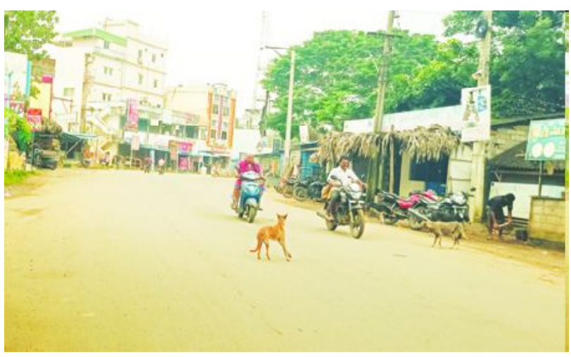
గోకవరం వెళ్ళే రోడ్లలో పలువురు ప్రమాదాల భారిన పడ్డారు. ద్వీచక్ర వాహనాలపై ప్రయాణించేవారు ఇబ్బందులు పడుతున్నారు. నెహ్రూ కాలనీ ఎంబ్రెస్ వద్ద, కాలనీలోను ఎక్కువగా గ్రామ సింహాలు ప్రజలను భయభ్రాంతులకు గురి చేస్తున్నాయి. సంబంధిత అధికారులు స్పందించి వీధి కుక్కలను నిరోధించాలని ప్రజలు, ద్వీచక్ర వాహన దారులు కోరుతున్నారు.

జగ్గంపేట సెప్టెంబర్ 22 (సందేశం టైమ్స్): జగ్గంపేటలో వీధి కుక్కల బెడదతో ప్రజలు నానా ఇబ్బందులు పడుతున్నారు. తరచూ రహదారి వెంబడి సంచరిస్తూ రోడ్లపై అటు ఇటు పరుగులు తీస్తున్నాయి. ఎక్కడ చూసిన కుక్కలు సంచరిస్తూ కనిపిస్తున్నాయి. హైవే ప్రక్కన సర్వీస్ రోడ్లలోను, గోకవరం రోడ్లలోను మాంసం దుకాణాలు వద్ద ఎక్కువగా సంచరిస్తున్నాయి. అలా సంచరిస్తూ రోడ్లకు అటు, ఇటు పరుగులు పెడుతున్నాయి. పరుగులు పెట్టే క్రమంలో ద్వీచక్ర వాహనాల్లో వదుతున్నాయి. వాహనదారులు ప్రమాదాల భారిన పడుతున్నారు. ఇటీవల కాలంలో జగ్గంపేట నుంచి ప్రజలు, ద్వీచక్ర వాహన దారులు కోరుతున్నారు.